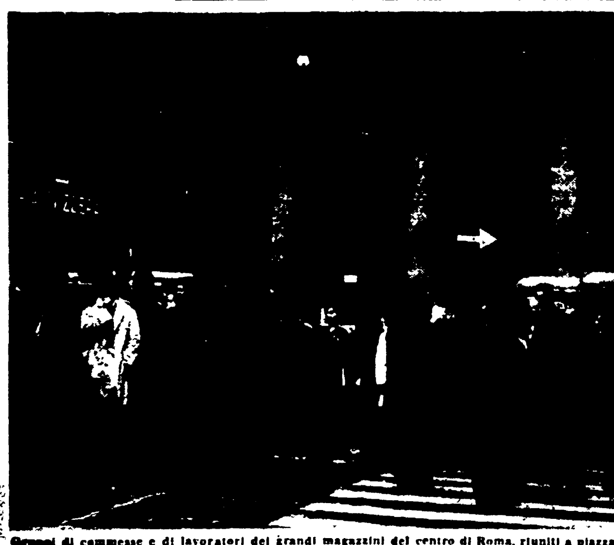
Gruppi di commesse e di lavoratori dei grandi magazzini del centro di Roma, riuniti a piazza S. Silvestro, commentano la sospensione dello sciopero

I negozi, almeno per ora, restano aperti.