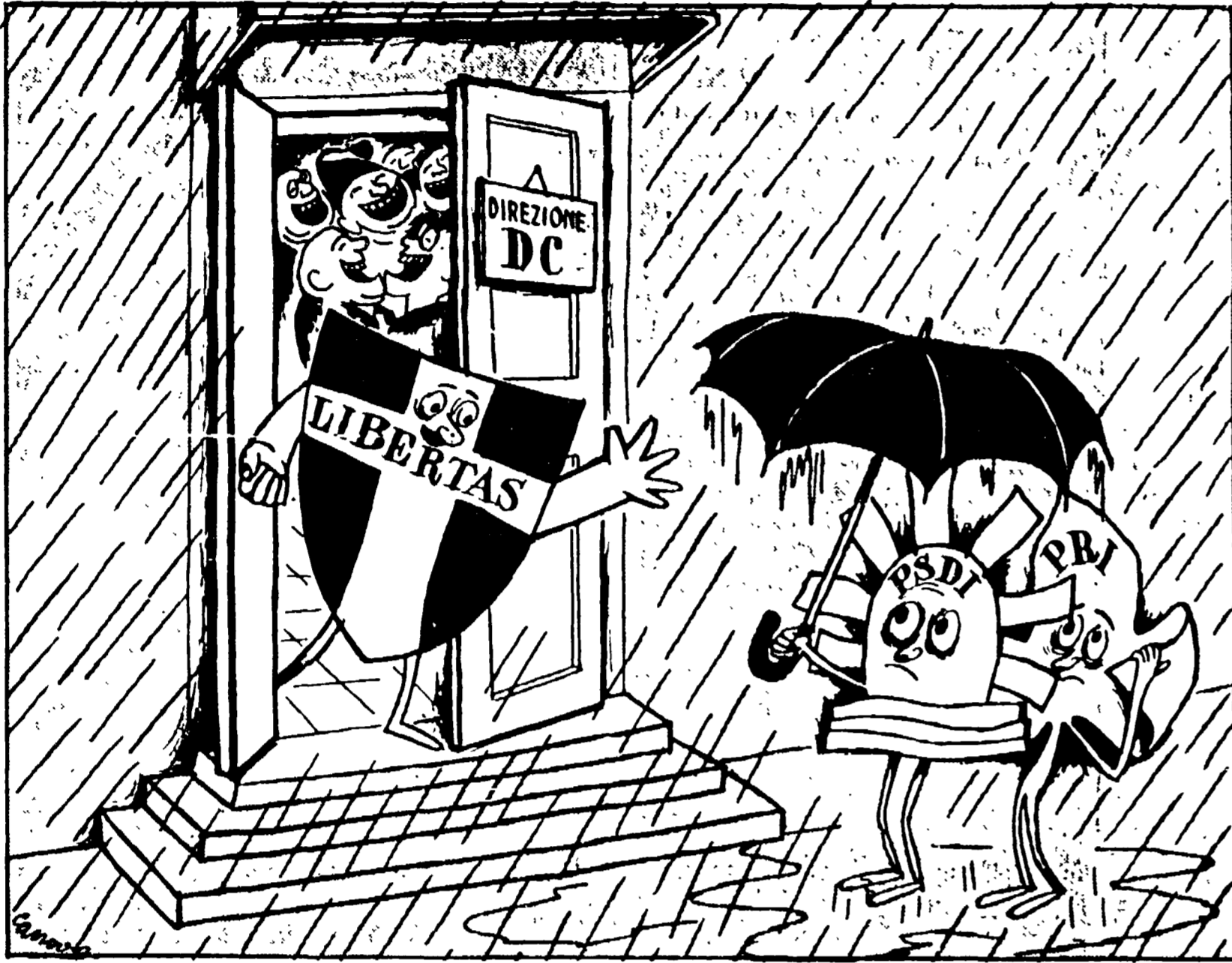
LA D.C.: Ripassate un'altra volta. Per oggi non c'è niente

La riunione della Direzione democristiana