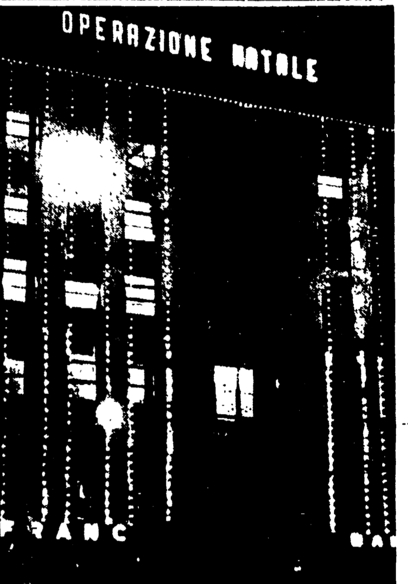
MILANO - L'energica scritta luminosa che l'industriale Senatore Borletti ha fatto piazzare sul tetto del palazzo dei giornali in piazza Cavour