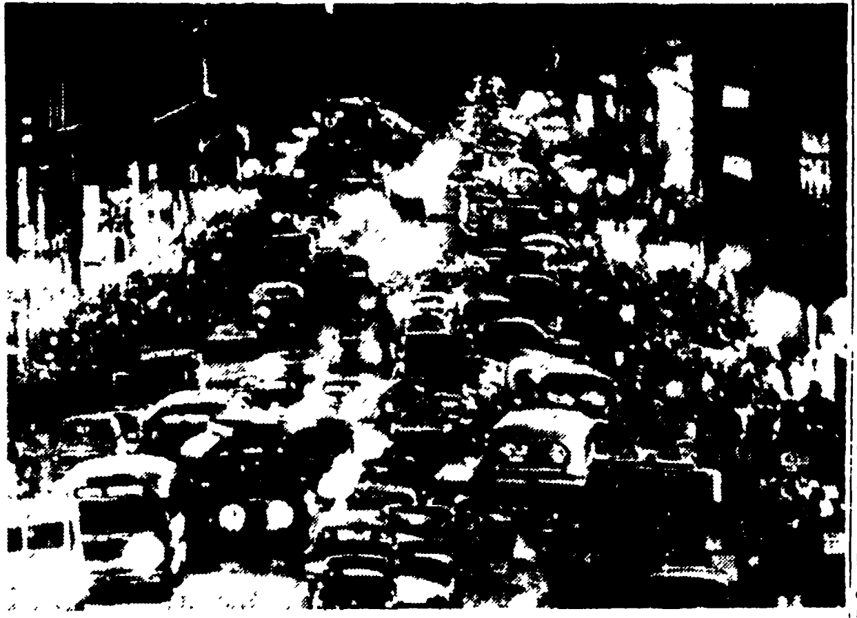
NEW YORK — Una visione del caotico traffico natalizio nella famosa « Quinta strada » della metropoli americana (Telefoto)