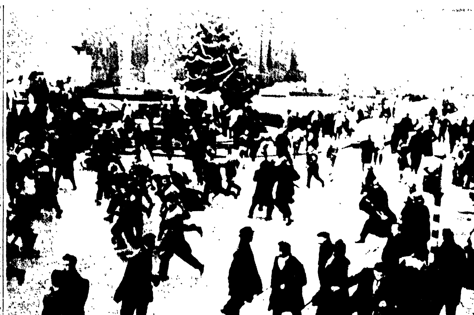
GHENT - Particolarmente violenti sono stati gli scontri verificatisi ieri nella cittadina industriale di Ghent. Nonostante che la polizia abbia fatto largo uso di bombe lacrimogene ed abbia più volte caricato la folla, investendola con getti di acqua gelida, i dimostranti hanno tenuto saldamente la piazza.

CHARLEROI, 28 - Alle tredici, il giornale radio diceva che era impossibile fornire notizie esatte sulla situazione. Eravamo ancora a Bruxelles, in un ristorante italiano del boulevard de Jardin Botanique.