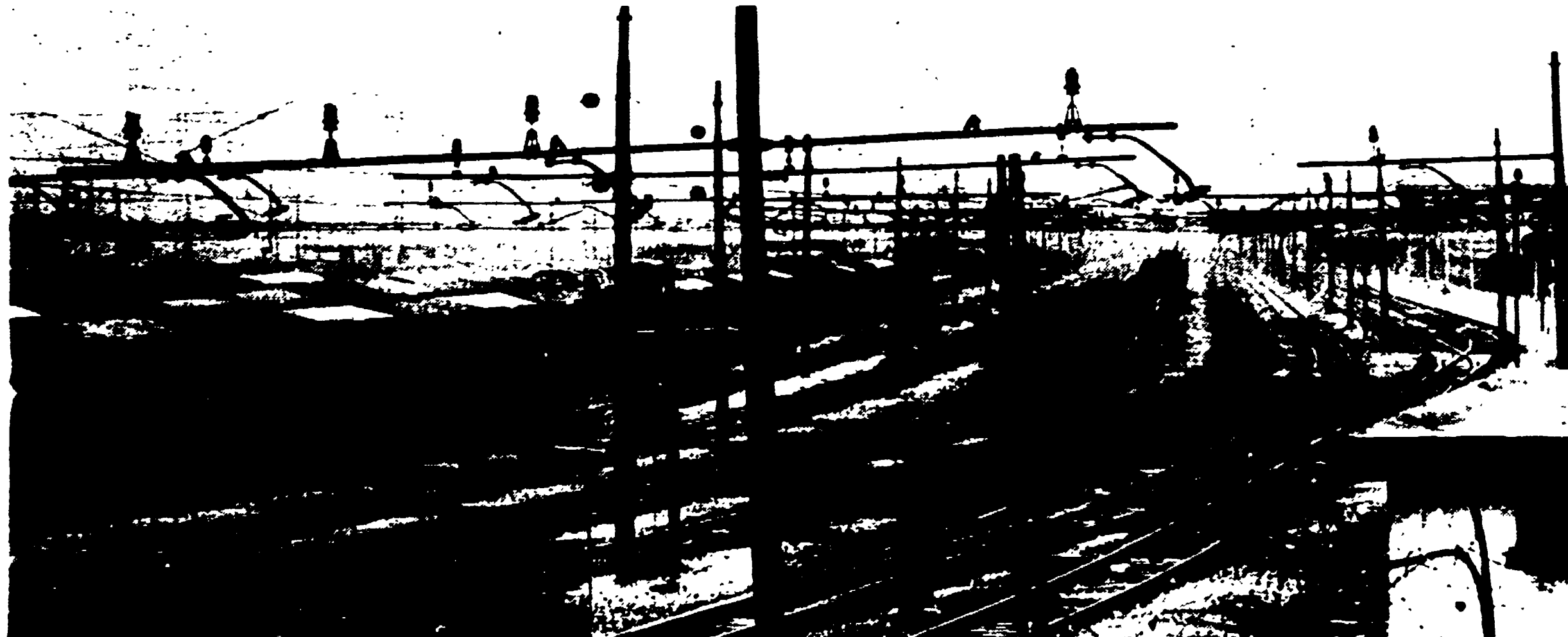
Gli impianti della stazione di Roma Termini completamente deserti durante lo sciopero