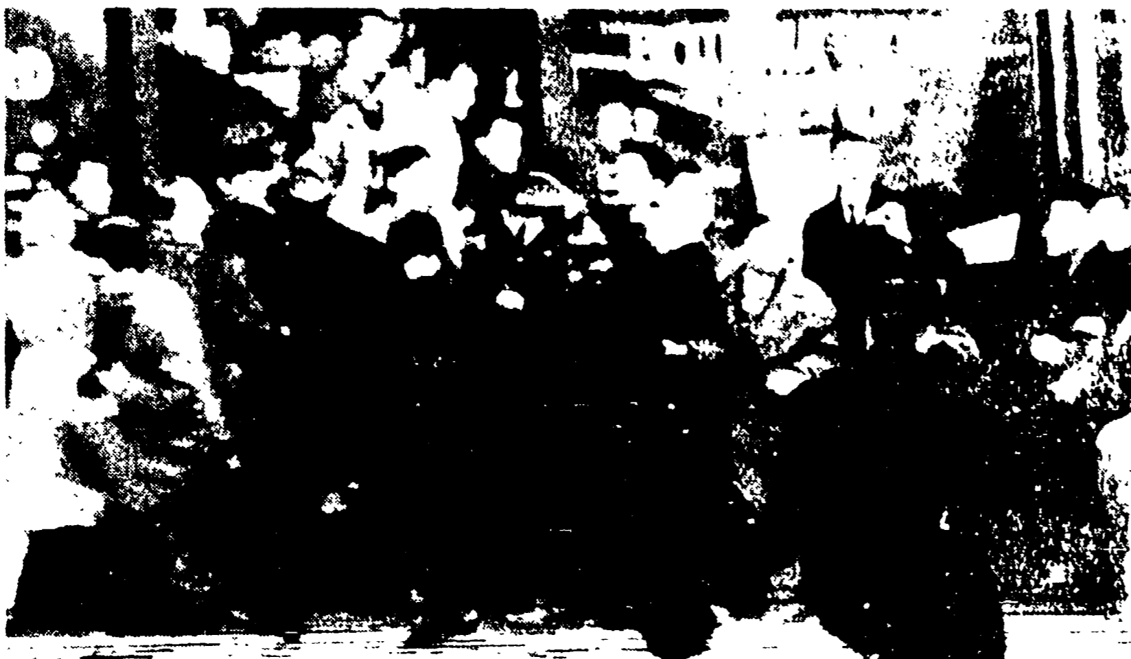
BRUXELLES - La gendarmaria scagliata contro i lavoratori in sciopero nel tentativo di stroncare le manifestazioni di strada

Avvenimenti gravi si verificano in questi giorni nel mondo. Giustamente essi sono sotto accusa in modo lampante l'una o l'altra delle potenze occidentali.