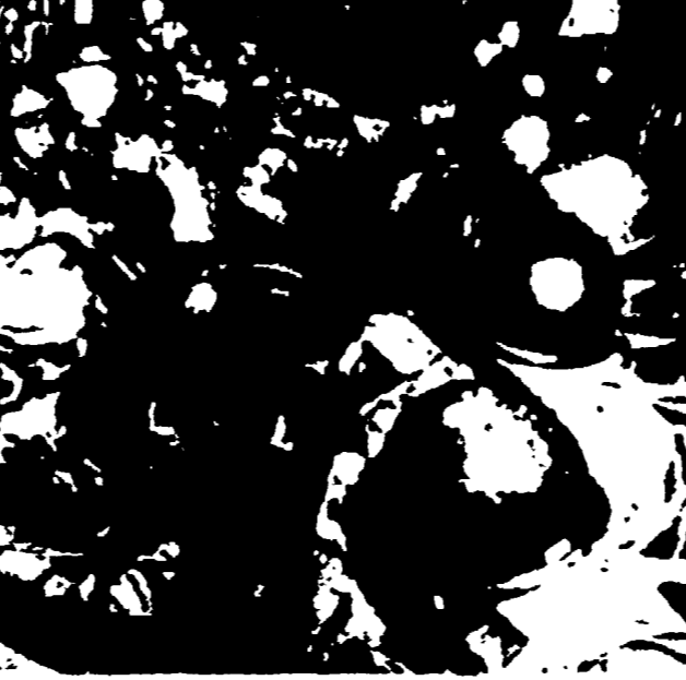
POPI (Carolina) - Truppe americane in assetto di guerra stipate in un aereo C-119. Si parla di queste truppe come di quelle pronte per l'intervento nel Laos.

SINGAPORE. 3 - Gli Stati Uniti hanno oggi da un mese e mezzo un contingente di truppe disposte per un intervento aggressivo nel Laos, un paese di cui la marina americana ha infatti dichiarato a Manila, capitale delle Filippine, che due navi traliccio con almeno 1.400 marine in assetto di combattimento sono salpite domenica scorsa dalla base di stanza nella baia di Subic per raggiungere la punta della 7ª flotta che naviga nel Sud-Est asiatico.