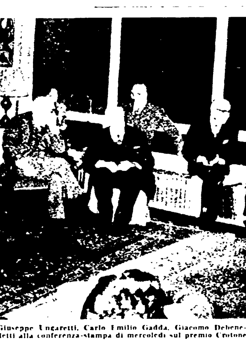
Ginepro Ungaretti, Carlo Emilio Gadda, Giacomo Debenedetti alla conferenza-stampa di mercoledì sul premio Crotone