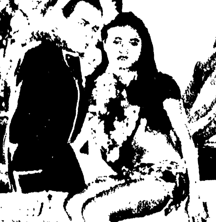
L'ha scoperta Brando - L'attrice Brando è una italiana di 19 anni che ha scoperto il suo talento...