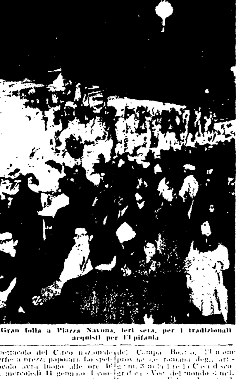
Gran folla a Piazza Navona, ieri sera, per i tradizionali acquedotti per il pipì.

La Befana della Gate. Al Teatro Pirandello, alle ore 9,30, avrà luogo oggi la distribuzione della Befana ai figli del socio del Circo Orfei della Federcoop. La manifestazione sarà presieduta dal senatore Giorgio Amendola, dal senatore Ottavio Pastore e dal senatore Molè. Il programma prevede uno spettacolo di beneficenza, una sfilata di donatori e una distribuzione di doni ai bambini del popolo.