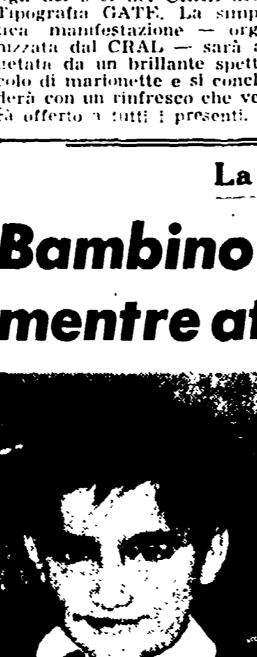
Il bambino ucciso per un tragico incidente.

Un bambino di 11 anni è stato ucciso per un tragico incidente. Il bambino era stato incaricato dalla madre di portare un cero in chiesa. Il bambino è stato ucciso mentre stava correndo verso la chiesa. La madre ha denunciato il fatto alle autorità competenti. Il bambino era stato ucciso mentre stava correndo verso la chiesa. La madre ha denunciato il fatto alle autorità competenti.