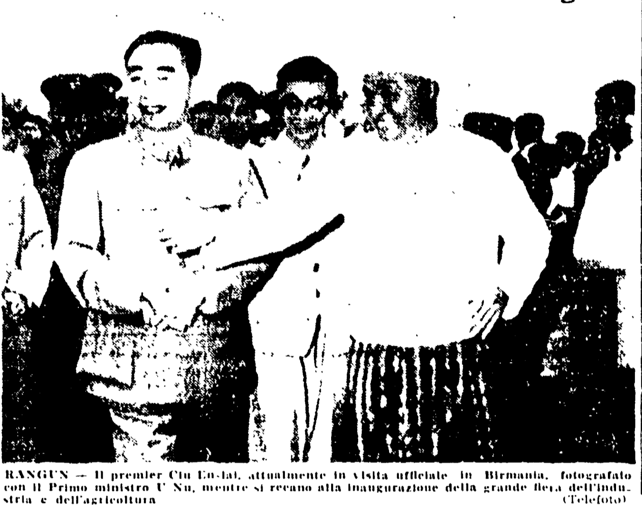
RANGUN. — Il premier Ciu En-lai, attualmente in visita ufficiale in Birmania, fotografato con il primo ministro U Nu, mentre si recano alla inaugurazione della grande fiera dell'industria e dell'agricoltura.

Sono incapaci di superare politicamente l'opposizione popolare