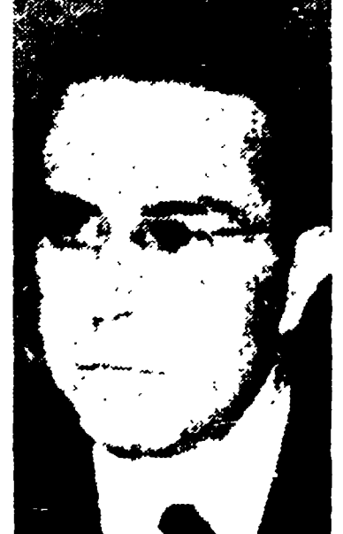
Il presidente della Bolivia, Victor Paz Estenssoro.