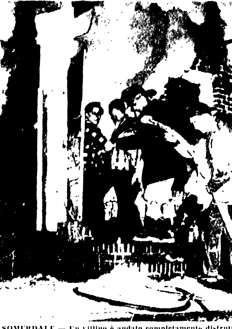
SOMERDALE - Un vilino è andato completamente distrutto in seguito a un violento incendio. Degli abitanti, rimasti intrappolati nella casa in fiamme, cinque sono morti: marito, moglie e tre bambini. Solo il nonno e un bambino si sono salvati. Nella telefoto: vigili e volontari cercano di domare le fiamme.