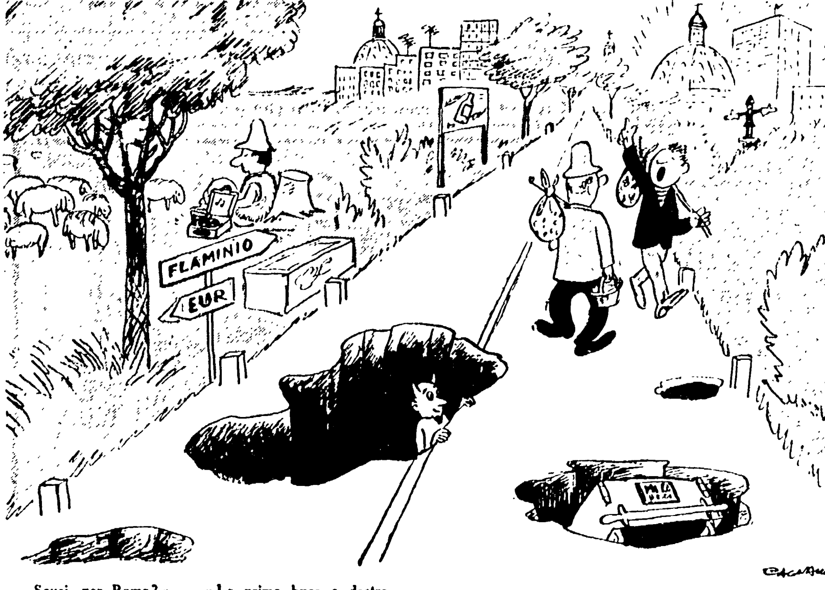
«Scusi, per Roma?» - «La prima buca a destra».

Servizio d'ordine. I compagni del servizio d'ordine debbono trovarsi alle ore 7,30 del mattino domenica al Teatro Jovinelli.