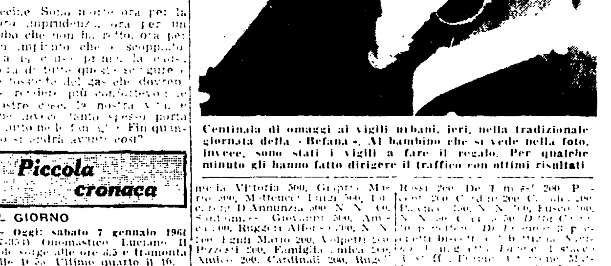
Centinaia di omaggi ai vigili urbani, ieri, nella tradizionale giornata della «Befana».

Centinaia di omaggi ai vigili urbani, ieri, nella tradizionale giornata della «Befana». Al bambino che si vede nella foto, invece, sono stati i vigili a fare il regalo. Per qualche minuto gli hanno fatto dirigere il traffico con ottimi risultati.