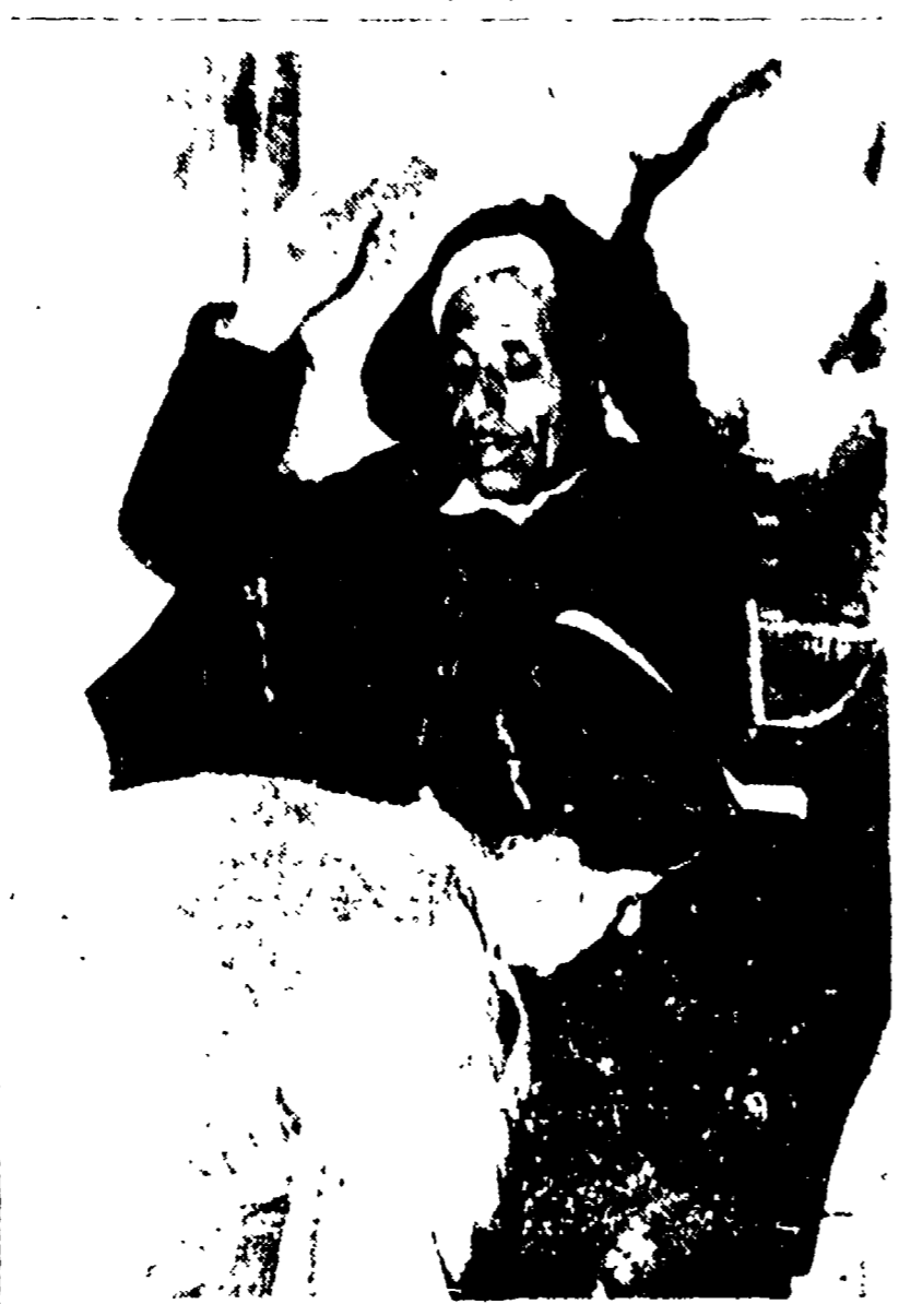
ALGERIA — Atmosfera «libera» e «distesa» per il referendum in Algeria. Un paracadutista francese perquisisce un elettore algerino.

l'incidente, ha in tutto ucciso sette e ferito due. Da esso è scaturito il villaggio di M'El-Moussa (Mila) sui monti dell'Amour. I musulmani francesi erano in sciopero in tutto il paese. L'esercito ha aperto il fuoco contro i musulmani che si rifiutavano di votare. L'esercito ha ucciso sette e ferito due. Da esso è scaturito il villaggio di M'El-Moussa (Mila) sui monti dell'Amour. I musulmani francesi erano in sciopero in tutto il paese. L'esercito ha aperto il fuoco contro i musulmani che si rifiutavano di votare.