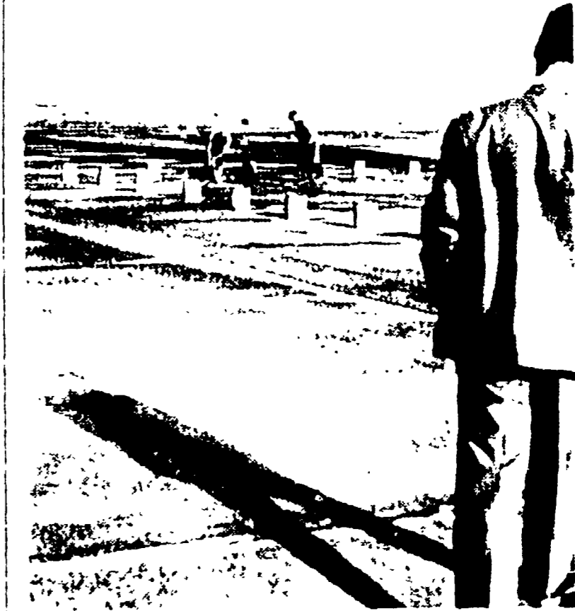
Continuano anche in questi giorni i lavori per sistemare e rafforzare le piste dell'aeroporto di Fiumicino

Bergamo — Ventiquattro militari sono morti e altri dieci feriti in un incidente che si è verificato a bordo di un camion, mentre stavano facendo ritorno da alcune esercitazioni di tiro svoltesi insieme al mezzo che li trasportava sull'autostrada Milano-Bergamo. Dieci soldati, hanno perso la vita nella tremenda sciagura. Nella foto: le salme di alcune vittime mentre la stradale procede alle misurazioni sul luogo del disastro.