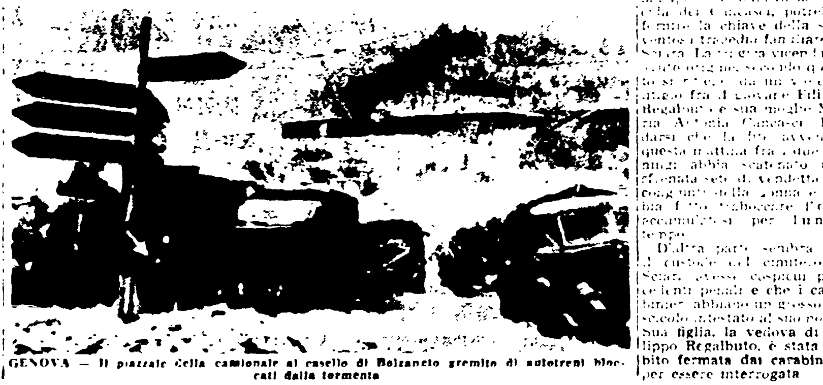
GENOVA - Il piazzale della camionerie al castello di Polignano gremito di autotreni bloccati dalla tormenta