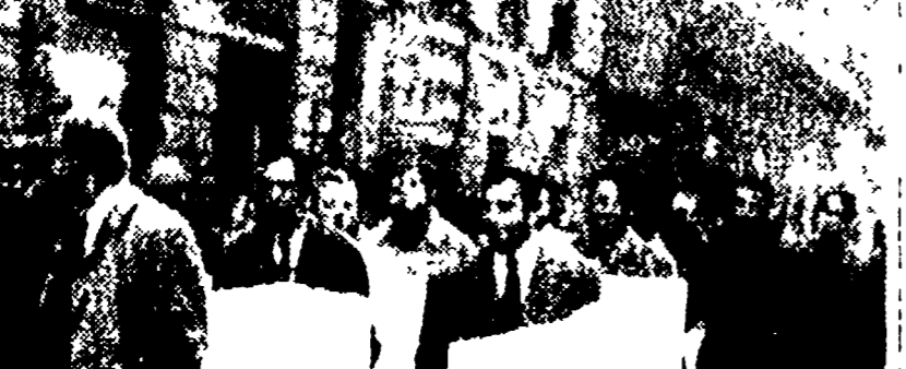
Operai in corteo a Firenze. La manifestazione è stata organizzata dai sindacati per celebrare i risultati ottenuti nella lotta sindacale.