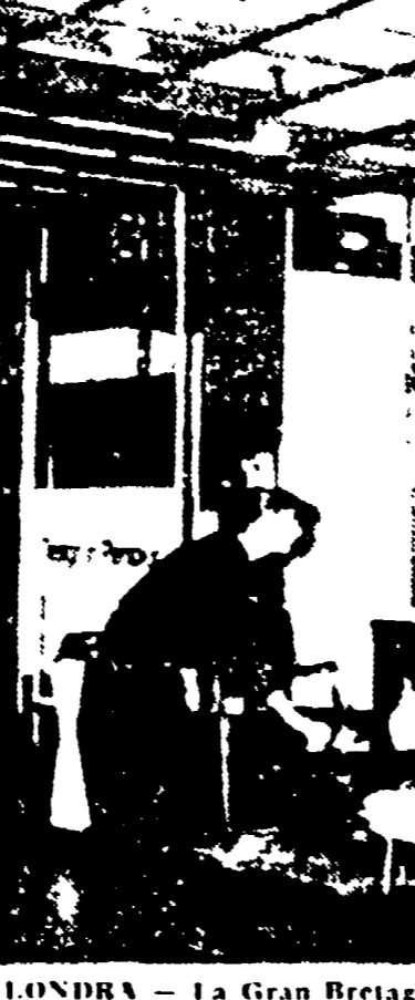
LONDRA — La Gran Bretagna ha un disoccupato di meno. Dopo lunghe discussioni la famiglia reale inglese ha infatti deciso di permettere a Tony Armstrong Jones, marito della principessa Margaret, di accettare un lavoro. Tony, quindi, il prossimo 29 gennaio, diverrà membro del « Council of Industrial Design », un ente governativo per lo sviluppo delle arti. Presso il « Council » egli si occuperà di antichità, non solo, ma anche di fotografia. Intanto le agenzie hanno già distribuito la foto dell'ufficio che è stato approntato per il nuovo disoccupato impiegato del « Council ».