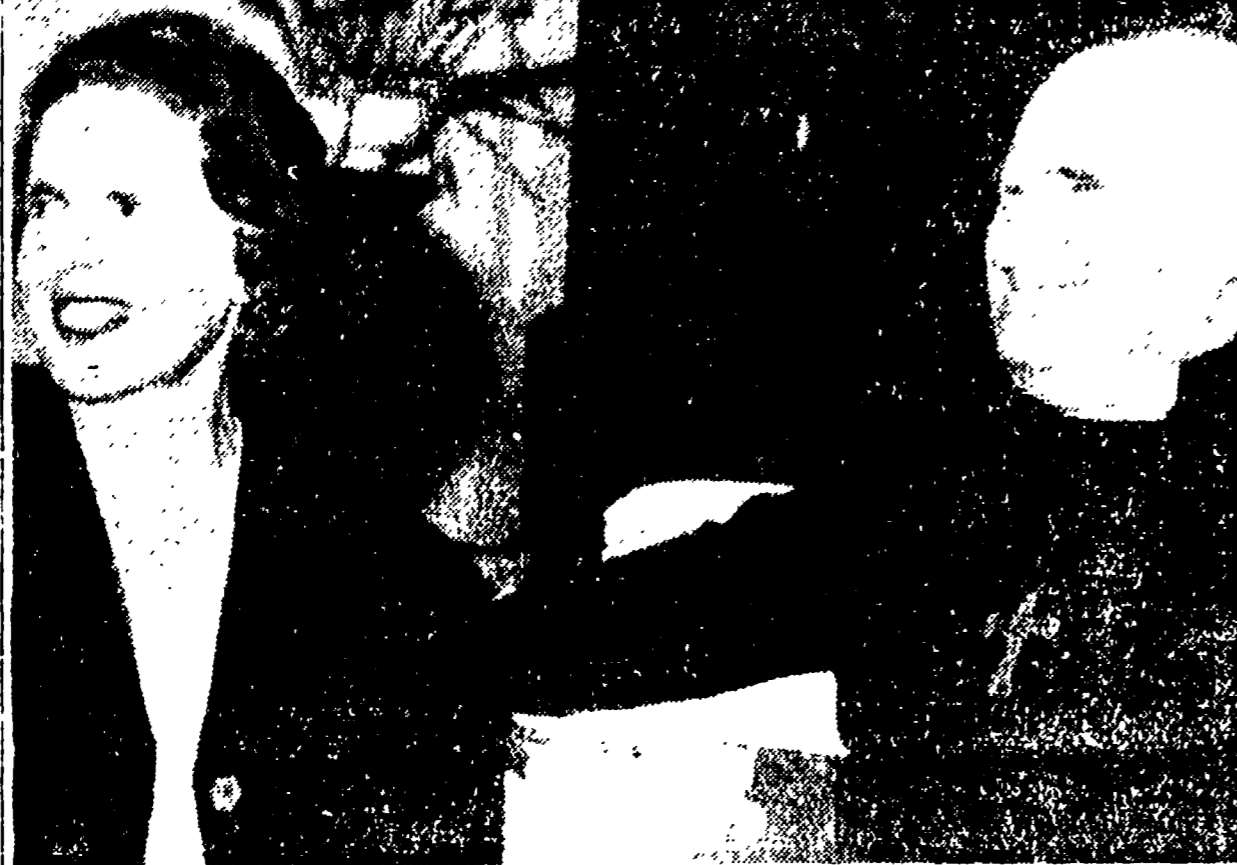
LONDRA — Elisabetta II ha nominato ieri il dott. A. M. Ramsey, di 56 anni, attuale arcivescovo di York, nuovo arcivescovo di Canterbury, la carica più elevata della chiesa d'Inghilterra. Il dott. Ramsey prenderà il posto del dott. Geoffrey Fisher, che aveva annunciato martedì il proprio ritiro per il 31 maggio prossimo. La nomina era prevista negli ambienti ecclesiastici inglesi. Ramsey è nato nell'Università di Cambridge dove suo padre, famoso matematico, insegnava. Nella foto con il nuovo primate con la moglie.