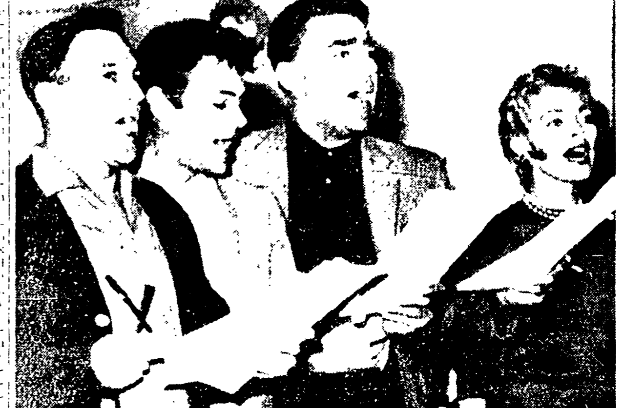
WASHINGTON — Ultime prove per il grande spettacolo che 26 attori democratici daranno sabato. Qui Gene Kelly, Tony Curtis, Peter Lawford (cognato di Kennedy) e Janet Leigh mentre provano uno sketch canoro del programma.

La cerimonia di inaugurazione sarà preceduta da una sfilata militare. Kennedy partirà da New York, dove ha scelto la sua residenza, e si dirigerà a Washington. La cerimonia sarà trasmessa in diretta televisiva. Kennedy è un cattolico, il primo presidente cattolico della storia degli Stati Uniti.