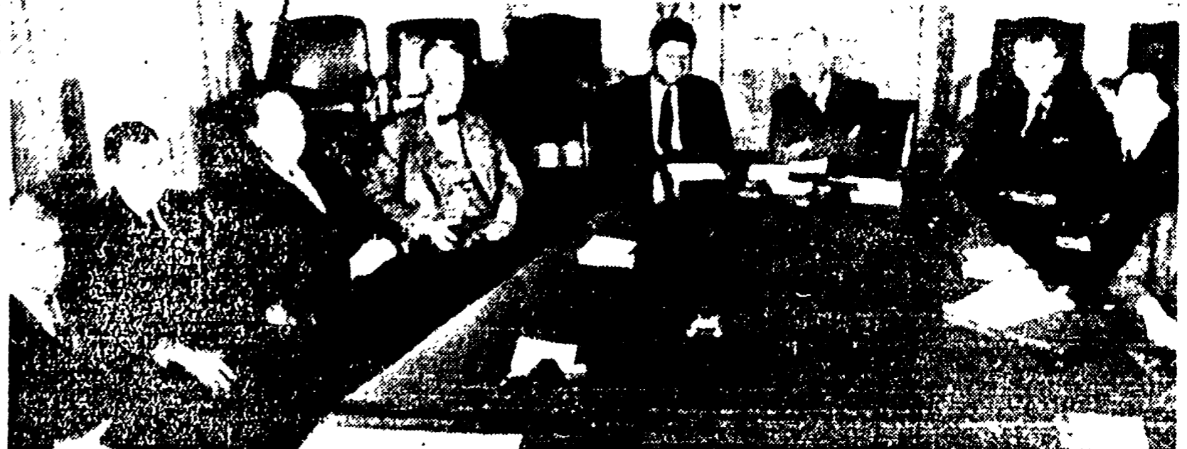
WASHINGTON — La riunione alla Casa Bianca fra i membri uscenti dell'amministrazione Eisenhower e quelli subentranti della nuova amministrazione di Kennedy. Eisenhower seduto a destra sta salutandolo Kennedy. Gli altri da sinistra sono il ministro della Difesa Robert McNamara, il ministro della Difesa Thomas Gates, il segretario di Stato Christian Herter. Dalla parte opposta, dal tavolo, verso destra, il ministro del Tesoro Robert Anderson ed il ministro del Tesoro designato Douglas Dillon.

La cerimonia di inaugurazione della nuova amministrazione di Kennedy, che si svolgerà il 20 gennaio, sarà una delle più grandi feste americane. Kennedy, che ha 43 anni, è il più giovane presidente della storia degli Stati Uniti. La cerimonia avrà luogo a Washington, nella Cattedrale di San Giovanni. Kennedy è stato eletto con un margine di 302 voti elettorali su 537 possibili. Il suo avversario, Richard Nixon, è stato sconfitto con 191 voti.