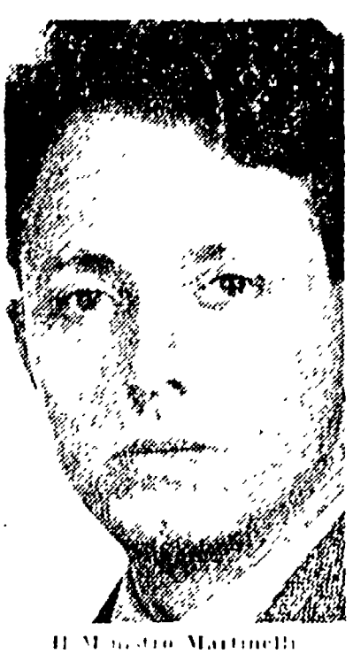
Il Ministro Martini