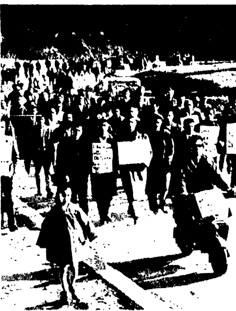
CARBONIA - Da cinque giorni sono in agitazione i minatori di Carbonia per ottenere migliori salari. Partito il lavoro per la supercentrale e la modifica del piano di Rinasella. Oggi i minatori di tutto il bacino carbonifero in sciopero generale. Nella foto un corteo di minatori che si è recato alla direzione della Carbonaria.