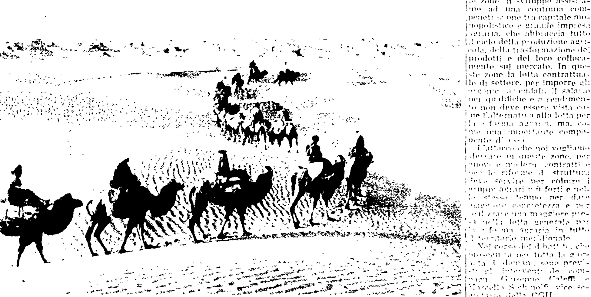
Una spedizione di geofisici dell'Accademia cinese delle Scienze, esplora il deserto del Takla Makan nel Sinkiang