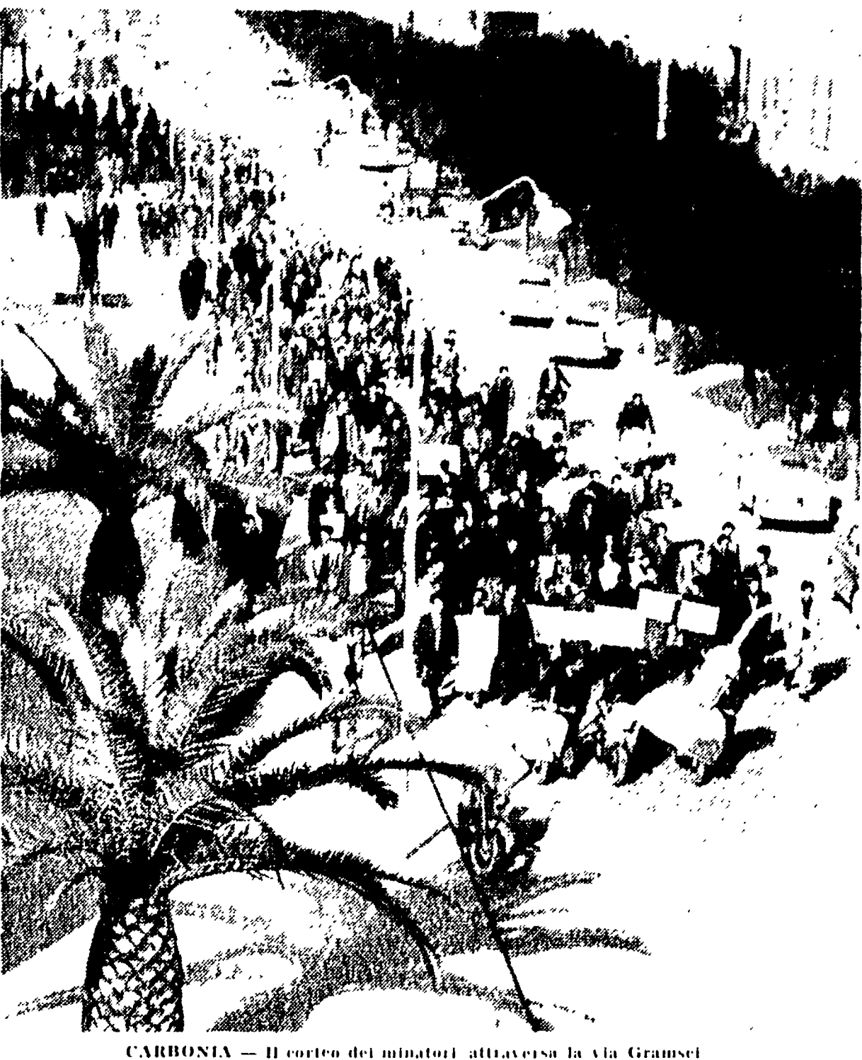
CARBONIA — Il corteo dei minatori attraverso la Via Gramsci

In un altro complesso a partecipazione statale la FERROMIN, si avrà domani uno sciopero di 24 ore. I minatori hanno chiesto la reintegrazione col lavoro e la situazione di basso salario. Il sindacato chiede che l'orario di lavoro sia di 40 ore settimanali e l'istituzione di un premio di rendimento. L'Intersind non ha ancora preso in considerazione la richiesta.