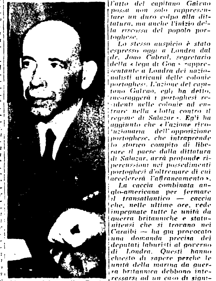
L'ex candidato alla Presidenza in Portogallo Humberto Delgado