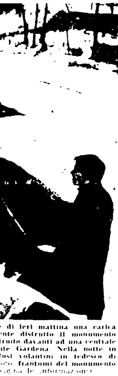
BOZZANO - Nelle prime ore di ieri mattina una carica esplosiva ha quasi completamente distrutto il monumento equestre al «Genio italiano» costruito davanti ad una centrale idroelettrica nel paese di Bozzano. Nella notte in alcune località sono stati diffusi volantini in tedesco di polemica antitaliana. Nella foto: i resti del monumento nella neve di seconda mattina. (Informazioni)