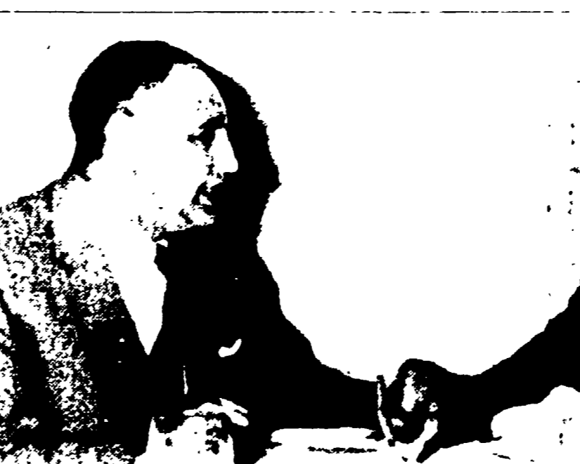
S. PAOLO DEL BRANILE - Il presidente eletto del Brasile Janio Quadros che assume il potere alla mezzanotte di oggi (a destra), parla con un amico al termine della notazione durante la quale ha annunciato le sue decisioni sul capitano Galvao e sulla nave «Santa Maria».

Il presidente eletto del Brasile Janio Quadros che assume il potere alla mezzanotte di oggi (a destra), parla con un amico al termine della notazione durante la quale ha annunciato le sue decisioni sul capitano Galvao e sulla nave «Santa Maria».