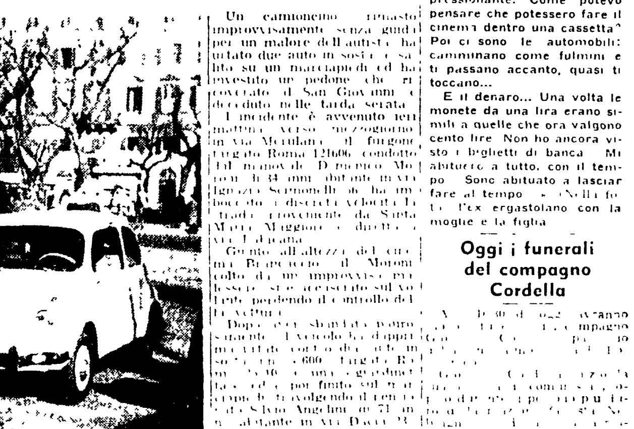
Il fuoristrada, subito dopo l'incidente sul marciapiedi di via Merulana. Accanto: il due auto contro cui ha urtato prima di investire il pensionato.

L'incidente è avvenuto all'altezza del cinema Brancaccio - Una donna, travolta da un'auto in via Mammoth, muore poche ore dopo l'incidente - Fiume contro un albero una «1100» a viale Tiziano