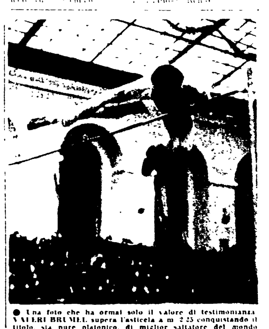
Una foto che ha ormai solo il valore di testimonianza. VALERI BRUMEL, supera l'asticella a m. 2,25 conquistando il titolo, sia pure platonico, di miglior saltatore del mondo

La corsa, che si svolgerà in 14 tappe, è stata presentata a Roma durante una conferenza stampa. Il direttore generale della corsa, Giuseppe Sestini, ha annunciato che la partenza sarà da Torino il 2 febbraio. La corsa si svolgerà in 14 tappe, con l'ultima tappa che sarà da Sassari a Cagliari. Sestini ha sottolineato che la corsa è stata organizzata in omaggio alle celebrazioni di «Italia '61». La corsa sarà una delle più importanti del calendario italiano. Sestini ha anche annunciato che la corsa sarà una delle più importanti del calendario italiano.