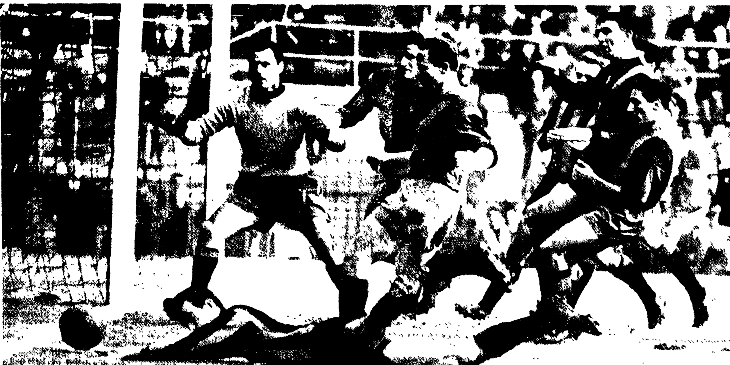
INTER CATANIA 0-0 — Gli etnei sono stati addirittura schiantati dal ritmo micidiale dell'Inter. Merito vuole si dica, però, che non hanno saputo nemmeno imposte una tattica ad ogni...

Il primato dell'Inter e la resurrezione dei viola argomenti del giorno