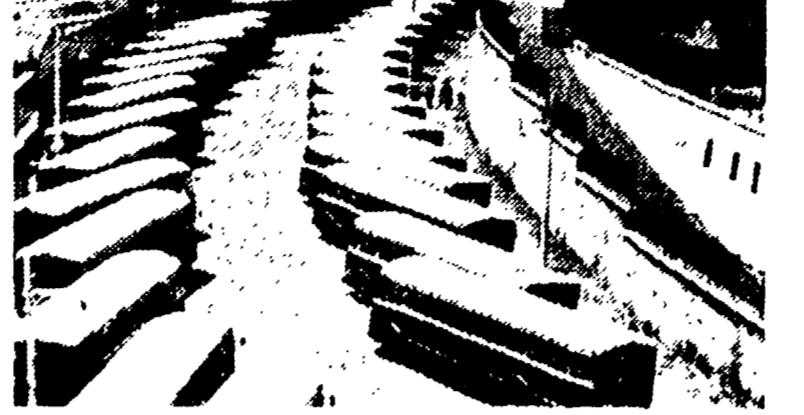
Sabato prossimo, oltre 400 annunciati sciopero di 24 ore delle autolinee pubbliche della regione, sciopero anche i tranvieri dell'ATAF.

Convocato per oggi l'attivo sindacale Lo sciopero delle autolinee della regione