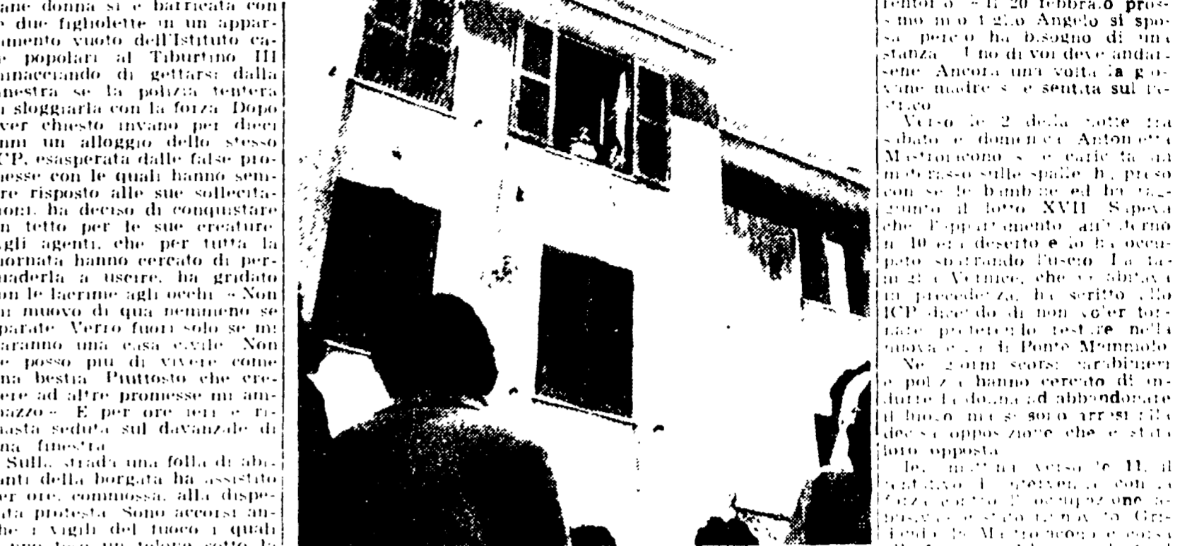
La folla dinanzi alla palazzina di via Trionfale mentre la giovane madre si sporge dalla finestra.

Quando è arrivata la polizia si è seduta su un davanzale - « Non esco, piuttosto mi ammazzo » - Sono accorsi i vigili - La solidarietà dell'intera borgata