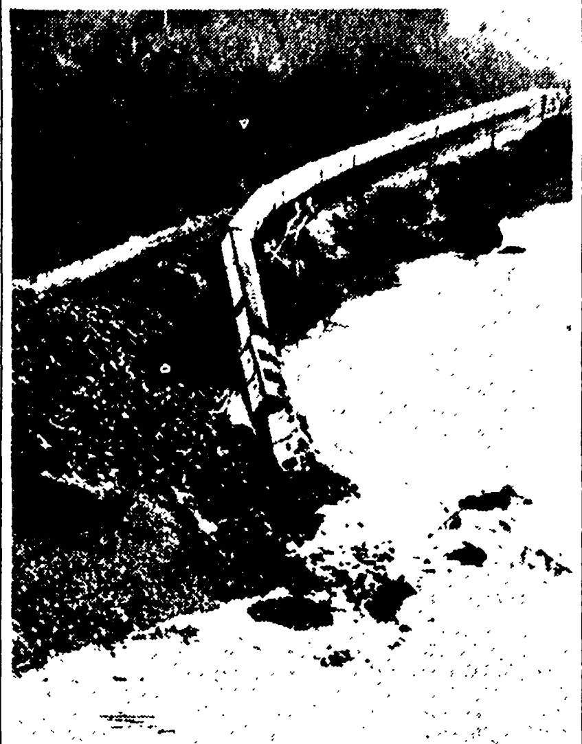
PORTLAND (USA) — Il famoso treno «Union Pacific», che dalla California meridionale sale costeggiando l'Oceano Pacifico fino allo stato dell'Oregon è stato investito da una frana caduta da una montagna che costeggia i binari.