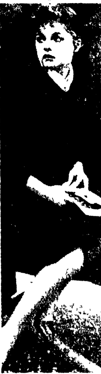
Virna Lisi sta riproponendo in fretta la strada della notorietà alla quale diceva di voler rinunciare all'epoca del matrimonio. Le parole di Virna Lisi sono: «Non si sono mai facilmente riproposte»