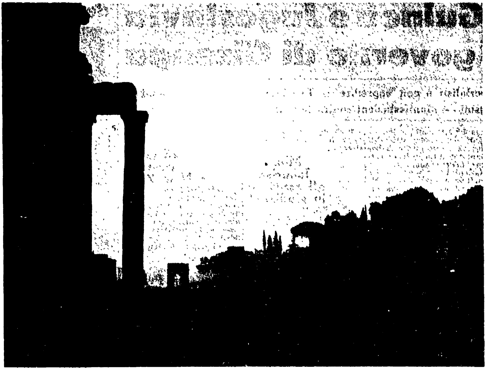
Un aspetto del Palatino di Roma al momento della massima copertura del sole