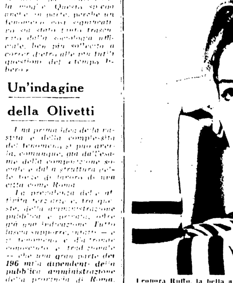
Leonora Billo, la bella attrice la cui notorietà sembrava destinarsi dopo le belle affermazioni che all'epoca di «I ciottolini», ne avevano fatto parlare come una delle speranze del nostro cinema, è nettamente in ripresa. Risistemato il suo pubblico attraverso la «Lina», ora Leonora si accinge ad interpretare numerosi film di buona qualità. Il primo sarà «La leggenda di Inea», che si varrà oltre che di Leonora di un «cast» di attori di livello internazionale.