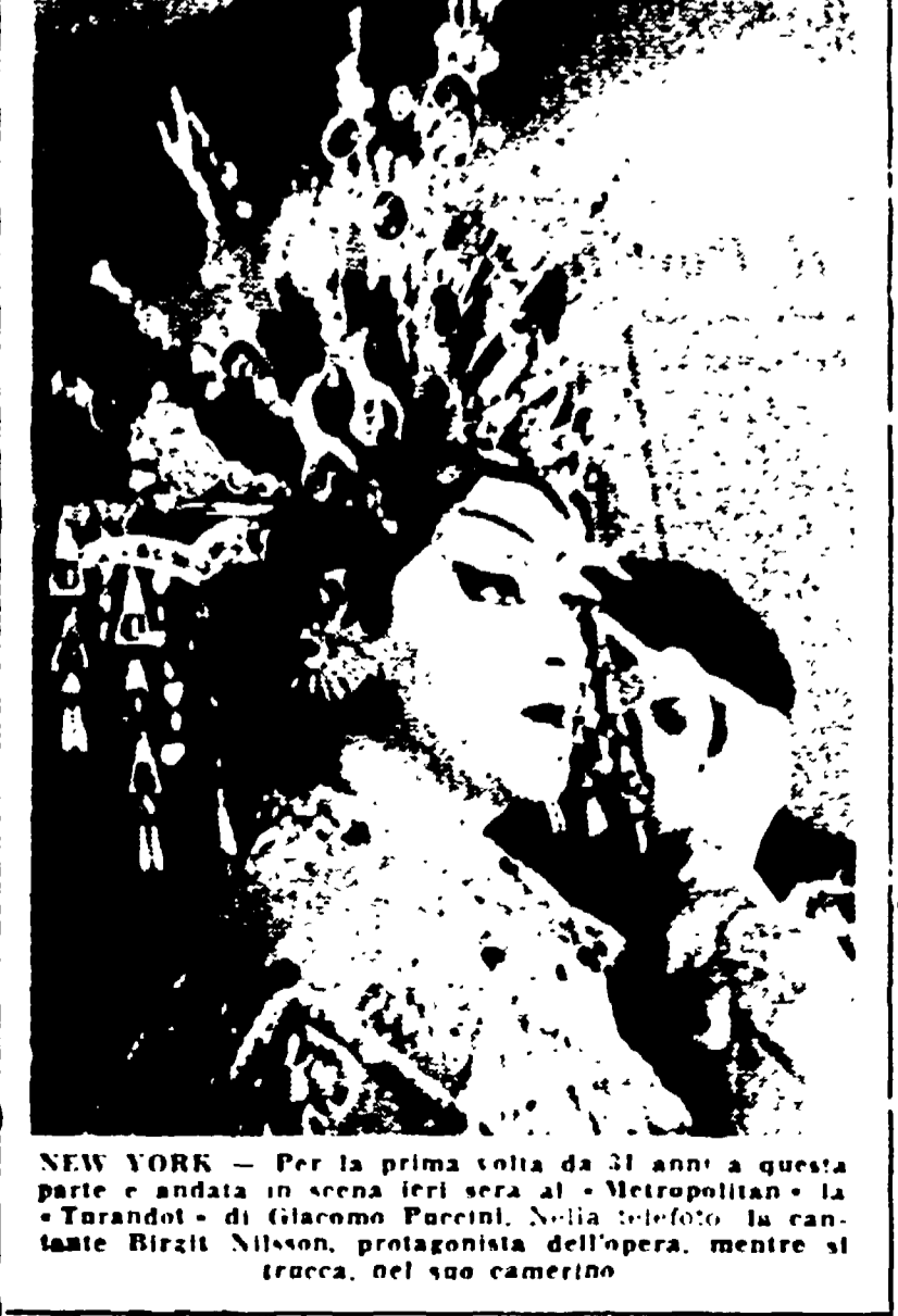
NEW YORK — Per la prima volta da 21 anni a questa parte è andata in scena l'opera «Turandot» di Giacomo Puccini. Nella foto: la cantante Birgit Nilsson, protagonista dell'opera, mentre si trucca, nel suo camerino.