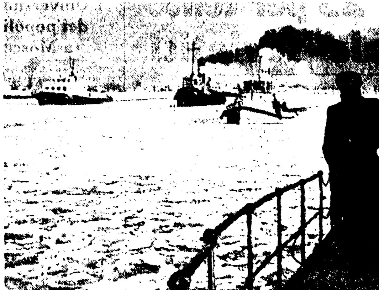
VARSAVIA. Rompighiaccio polacchi e della RDT in navigazione sul fiume Oder completamente ghiacciato nei pressi dell'estuario del fiume stesso a Szczecin, al confine tra Polonia e Germania