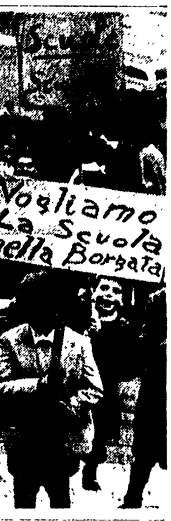
«Vogliamo la Scuola nella Borgata»