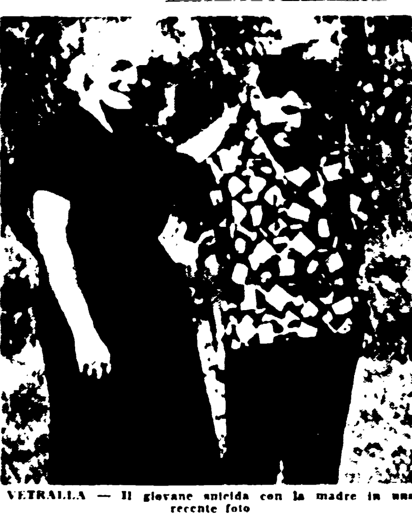
VITERBO - Il giovane suicida con la madre in una recente foto

Volava entrare nell'Accademia delle G.d.F. ma temeva che la sospensione di cinque giorni gli precludesse la carriera - Una dura fatica per potersi recare a scuola tutti i giorni - La lunga agonia con accanto la mamma e la sorella