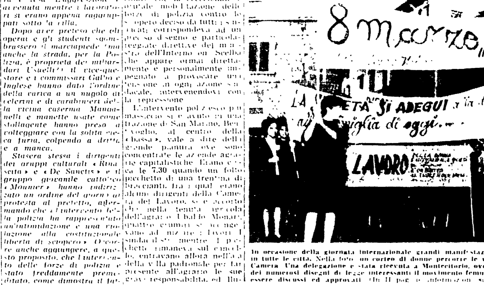
In occasione della giornata internazionale grandi manifestazioni unitarie hanno avuto luogo in tutte le città. Nella foto un corteo di donne percorre le vie della capitale per recarsi alla Camera. Una delegazione è stata ricevuta a Montecitorio, ove ha sollecitato l'approvazione dei numerosi disegni di legge femminili che tuttora attendono di essere discussi ed approvati.