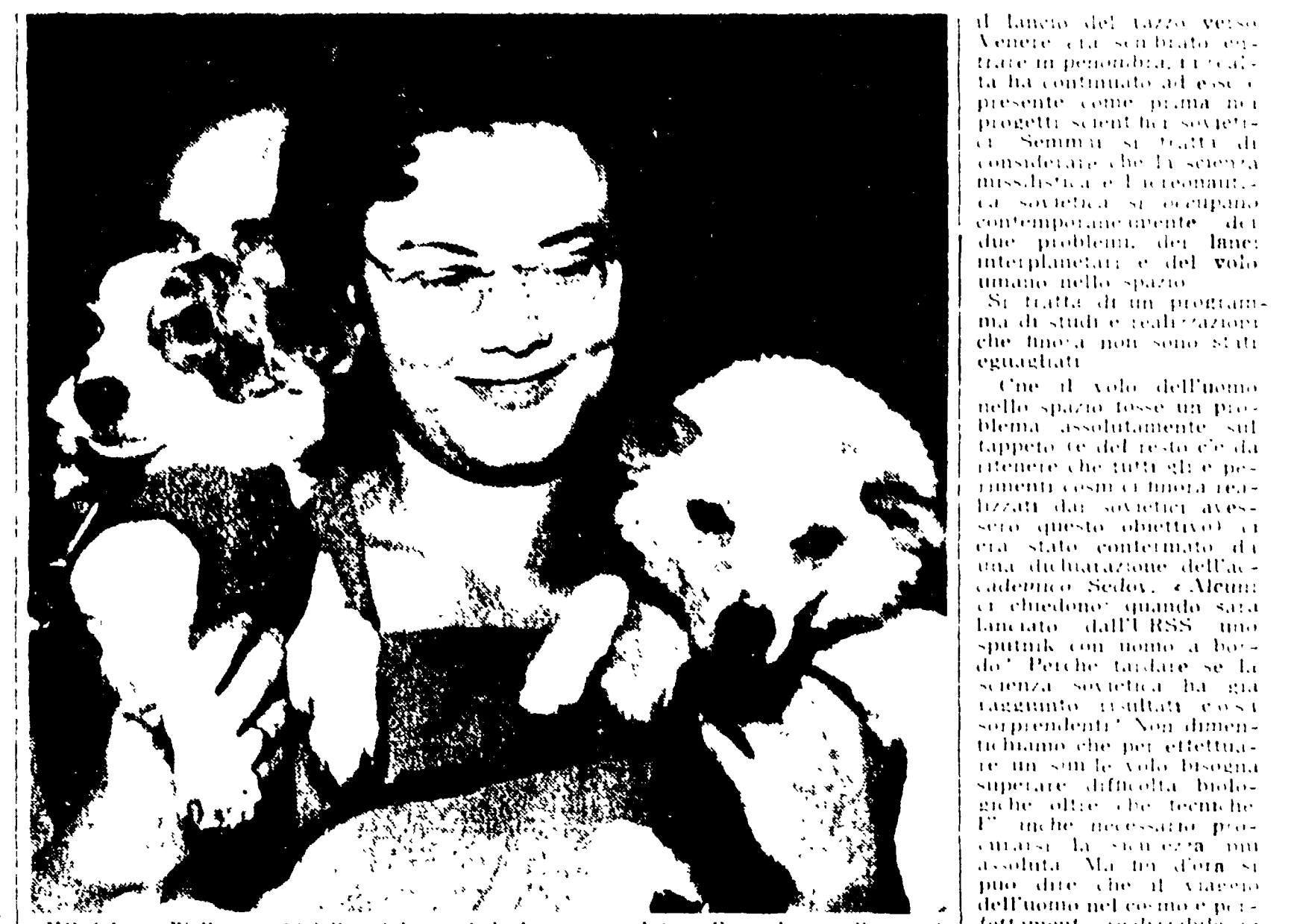
Mosca - Bielka e Strielka, i due cani che hanno preceduto Cernuska, nello spazio