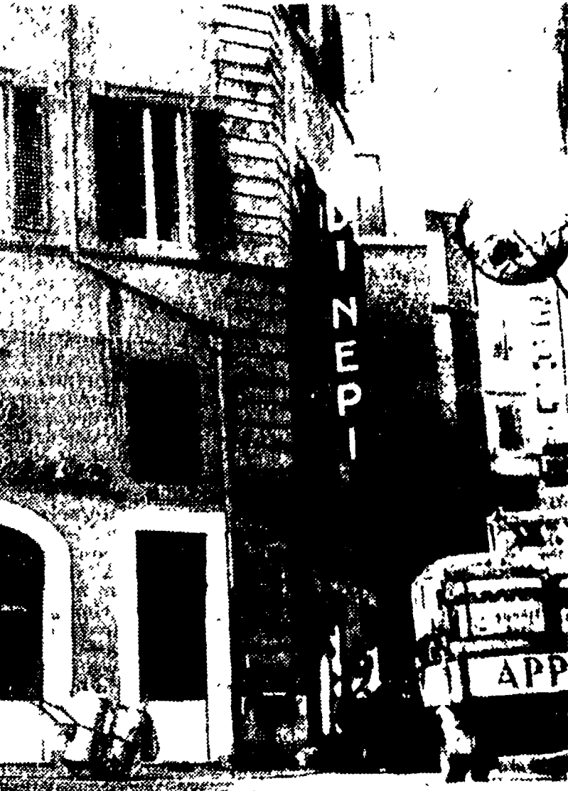
L'edificio visto dall'angolo piazza Capranica via degli Orfani è stato costruito cinquecento anni fa. Nel 1890 valeva 200.000 lire