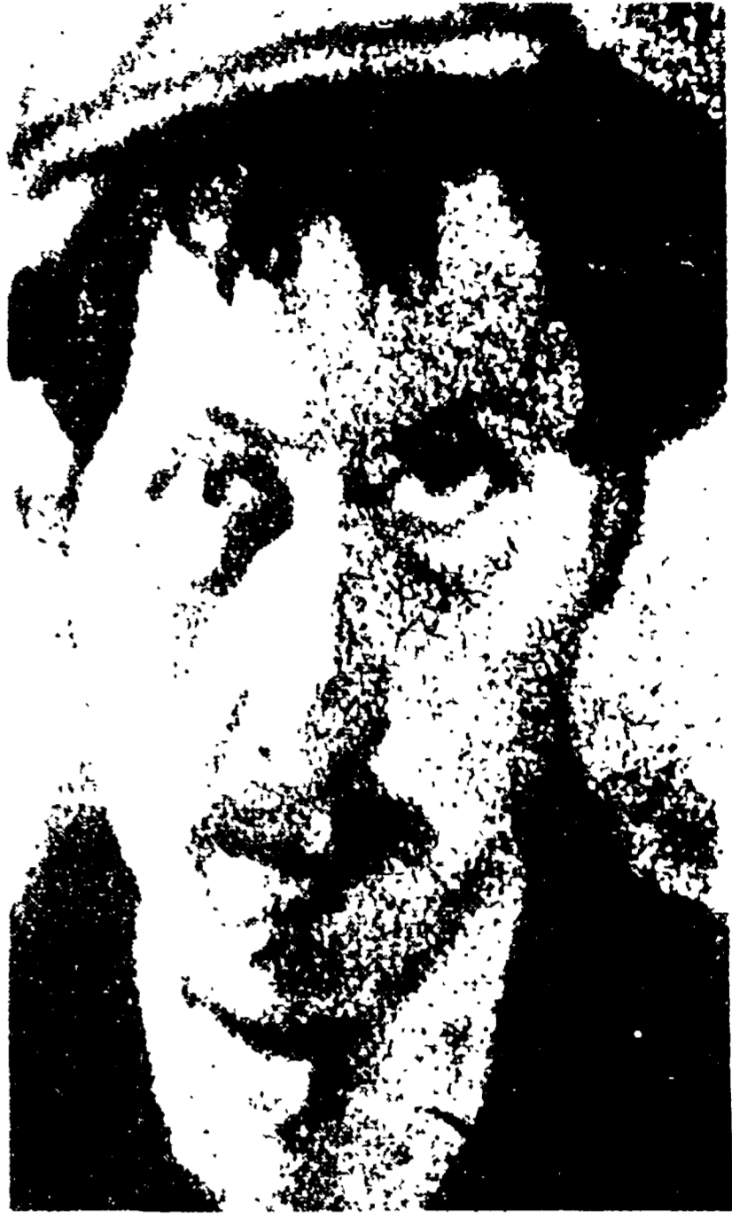
L'autoritratto del pittore francese Derain rubato dalla mostra di Palazzo Barberini e ora restituito

Il dipinto, di cui si è parlato in queste pagine, era stato rubato nel febbraio scorso da Palazzo Barberini, sede della mostra di dipinti di Derain. L'opera era stata rubata da un artista che si è poi convertito al cattolicesimo e ha restituito il quadro al parroco della chiesa di piazza Vescovio.