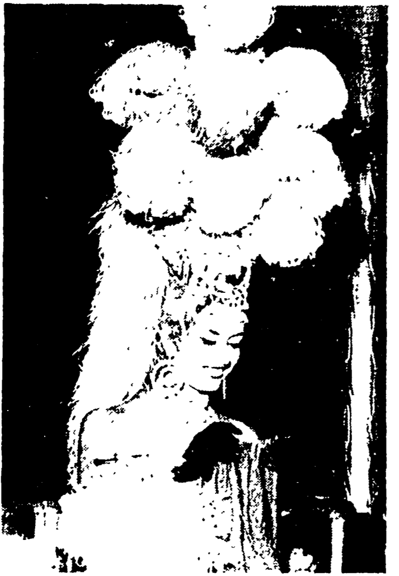
PARIGI — Ultime febbri parigie alle Folies-Bergère...