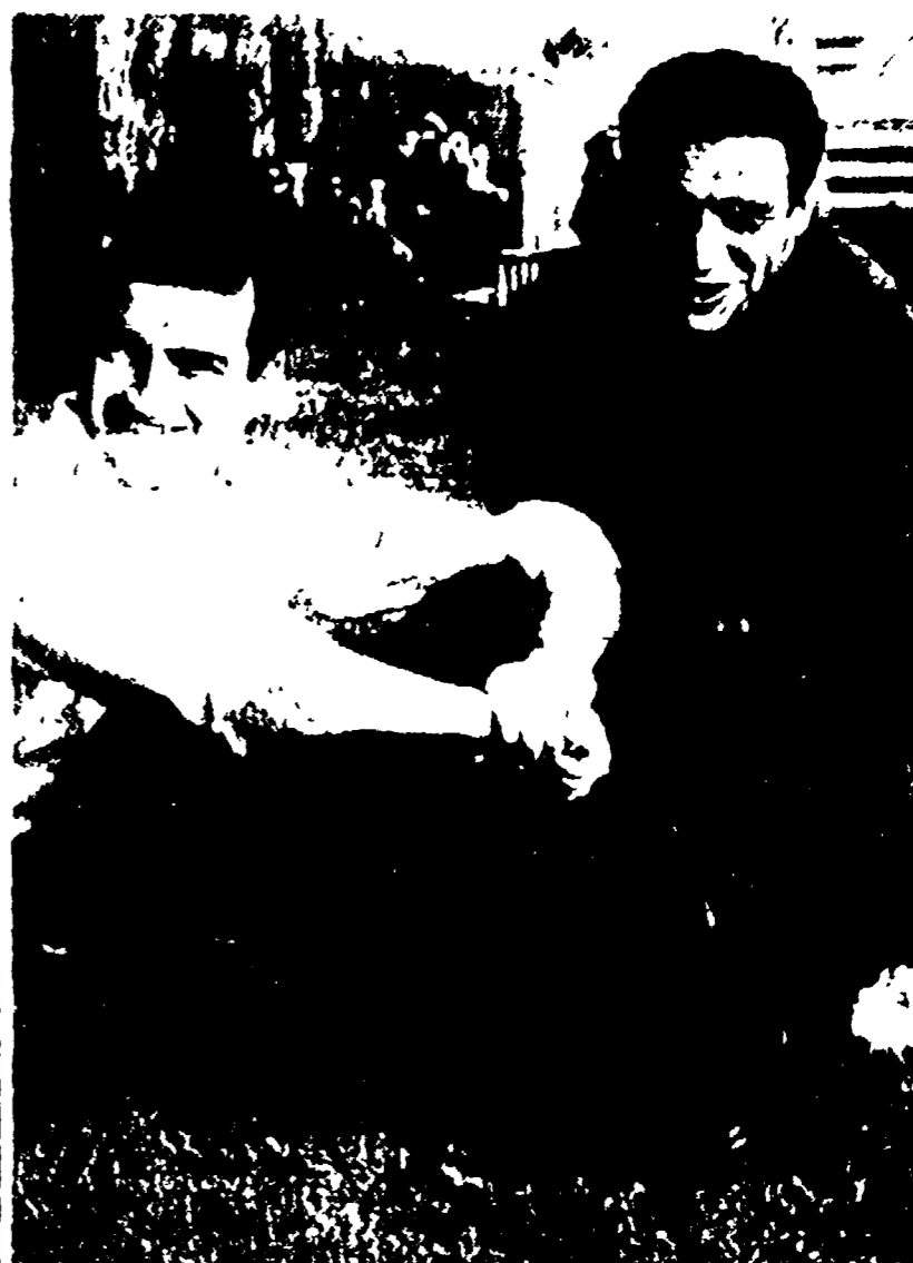
Informetta all'arrivo, gli ARSACCI e LOMASO assistono agli allenamenti del campione sorridente quad, a voler dire che la Roma vincerà anche senza di loro. Mi se per Guarneri non c'è veramente nessuna speranza di vederlo in campo nel derby, e per Tolomeo non è affatto da escludersi una deliziosa partita all'ultimo momento. L'araguna sarebbe dunque l'arma segreta della Roma?

Il duello fra i due russi, è stato il pepe e il sale della gara. Tutti gli uomini della Parigi-Nizza saranno fra i più brillanti protagonisti nella classica Milano-Sanremo che si correrà domani.