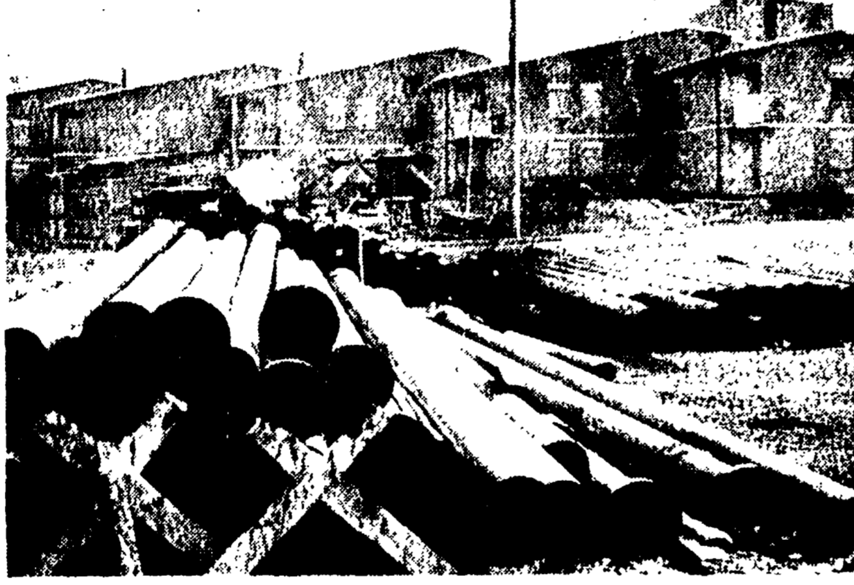
Le case deserte di Ponte Mammolo. Da un anno il Comune rinvia ogni giorno l'inizio dei lavori per portare al quartiere l'acqua, luce e gas.