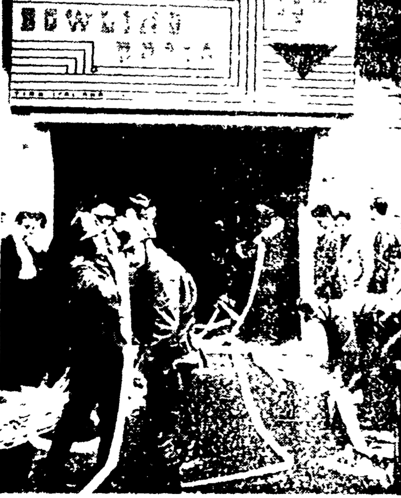
Una bombola di gas liquido è esplosa tra le mani di un operaio nei locali del Bowling. Il fumo della bomba americana è importato recentemente in Italia. Non ci sono stati feriti, per fortuna. Nel luogo fu gettata una bomba telefonata al Vigi del fuoco. Il tradizionale bagno inaugurato, con il Bowling. La ricreazione dagli estintori.