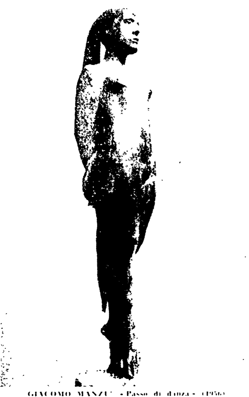
GIACOMO MANZÙ - «Passo di danza» (1956)

La bellezza di questa mostra... Guttuso e Manzù: un dialogo sull'uomo e l'arte moderna. Il tema della natura morta al centro della produzione dei due artisti.