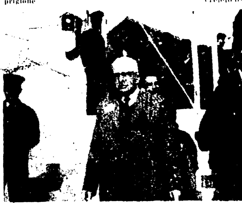
GERUSALEMME - Il ministro della giustizia di Israele Pinhas Rosen fotografato al suo arrivo nei locali dove si svolgerà il processo.