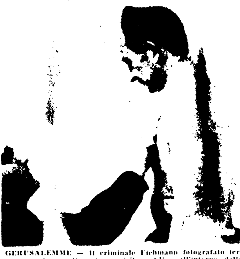
GERUSALEMME - Il criminale Eichmann fotografato ieri mentre viene sottoposto a visita medica all'interno della prigione.