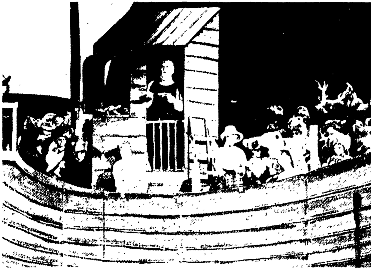
Una scena del «Diluvio di Noè» di Benjamin Britten rappresentato al Festival