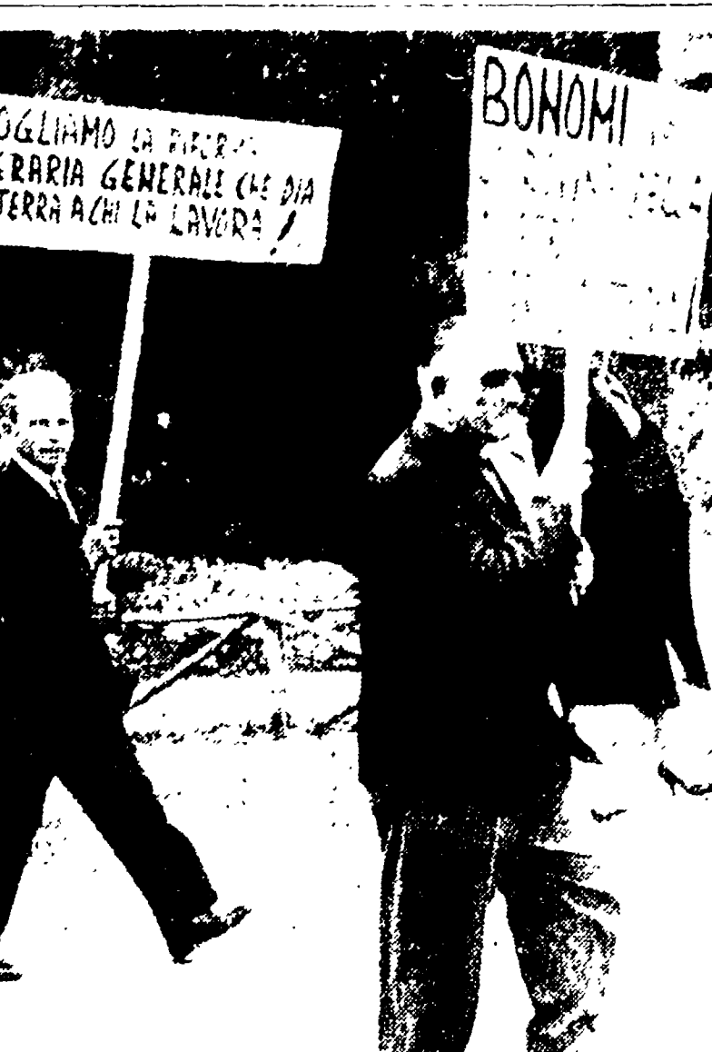
Un gruppo di contadini mentre si avvia alla manifestazione