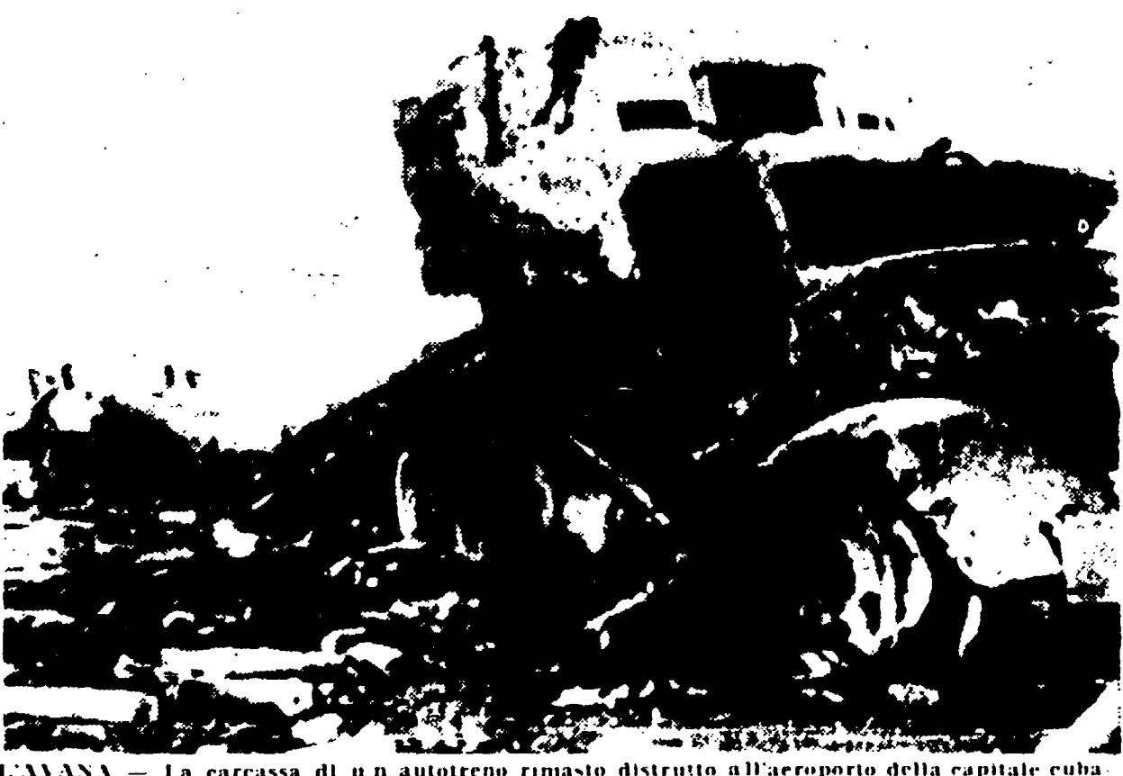
L'AVANA. - La carcassa di un autotreno rimasto distrutto all'aeroporto della capitale cubana durante il proditorio attacco dell'altro ieri.

Questi hanno visitato il padiglione di Gagarin e hanno espresso lottosa l'entusiasmo della scuola frequentata a suo tempo dal cosmonauta.