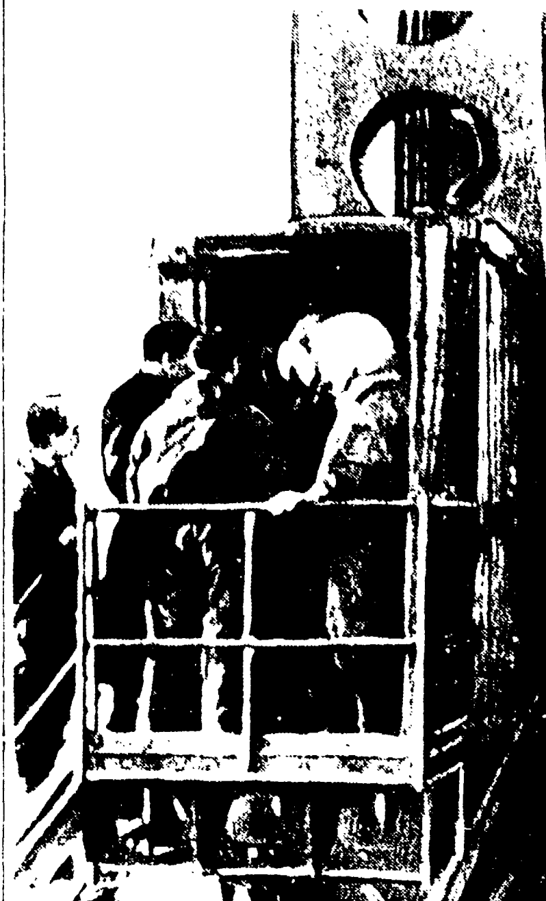
MOSCA. - Una delle straordinarie immagini diffuse sul volo del cosmonauta Yuri Gagarin, attorniato dai tecnici si appresta a salire sul motore della nave spaziale "Vostok".

Si sta allestendo il film sul volo di Gagarin. Alte decorazioni agli scienziati e ai tecnici