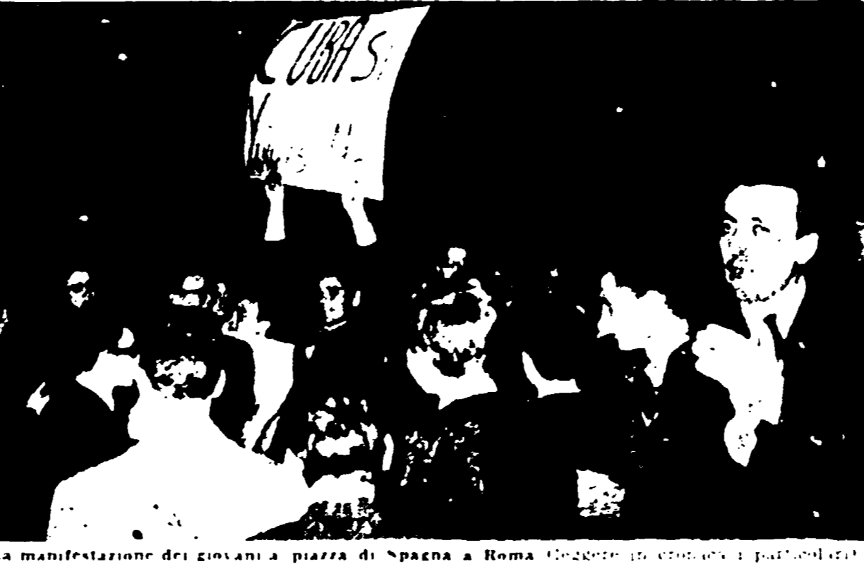
La manifestazione dei giovani a piazza di Spagna a Roma. (Cecchi in cronaca e paradosso)

In tutta Italia appassionata solidarietà per Cuba