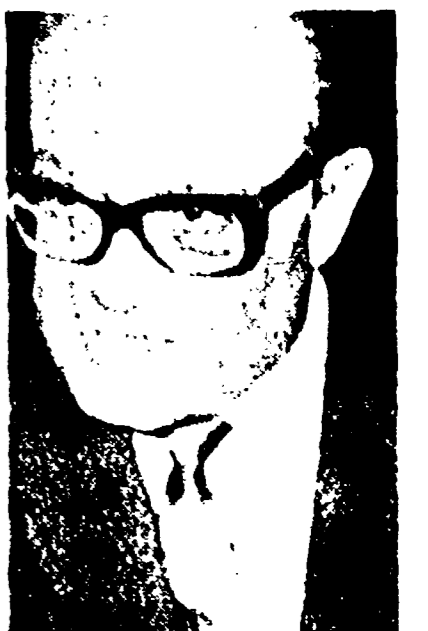
Il capo dei mercenari Cardona che ha esplicitamente rivelato la completezza degli U.S.A.