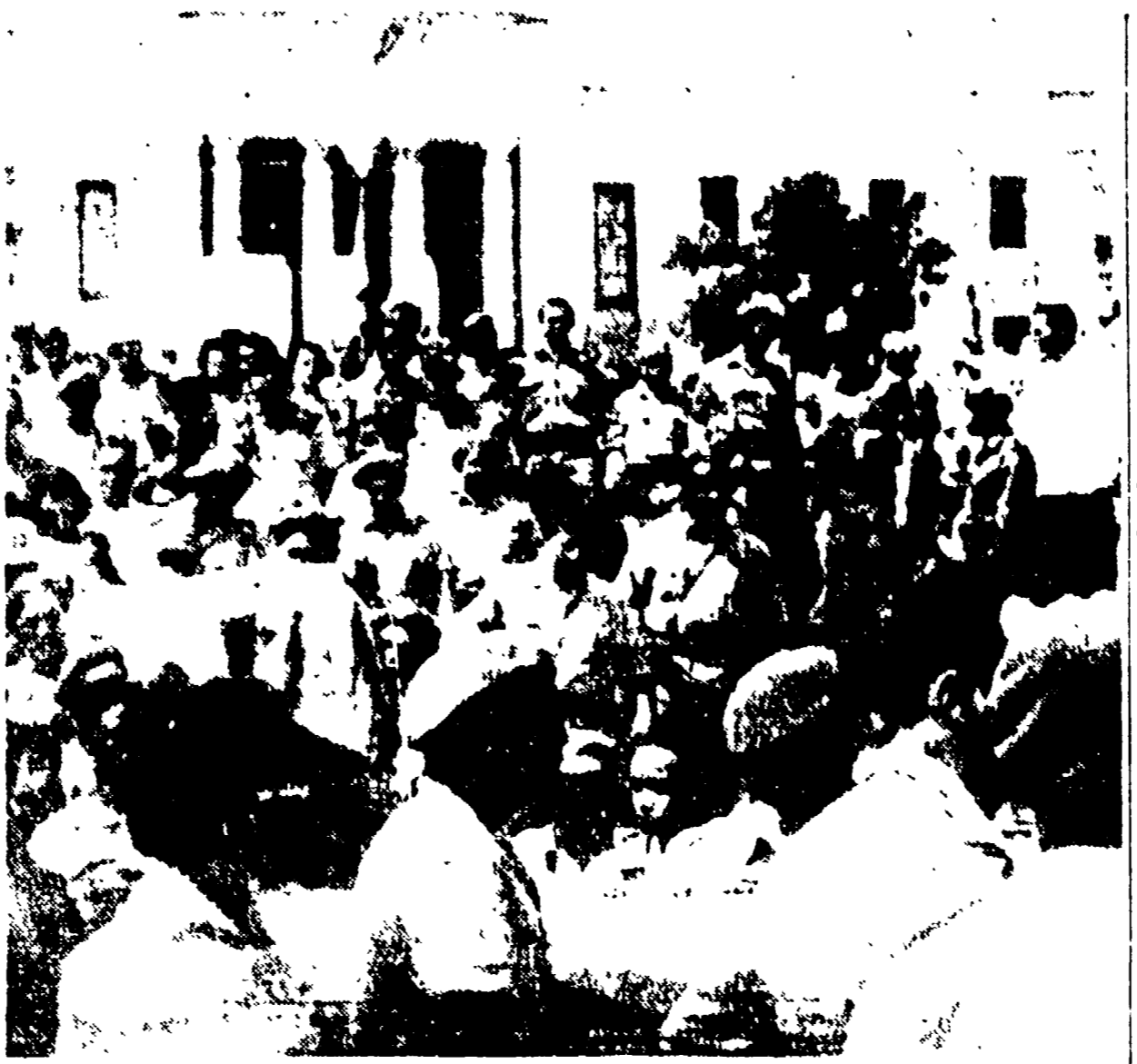
AVANA - Membri dell'esercito popolare e donne trasportano a spalla le bare delle vittime del bombardamento aereo di sabato.

CARACAS, 17. - Un'aggressione armata dell'imperialismo americano contro Cuba ha sollevato in tutta l'America latina immediate e veementi proteste e manifestazioni di solidarietà con la rivoluzione di Fidel Castro.