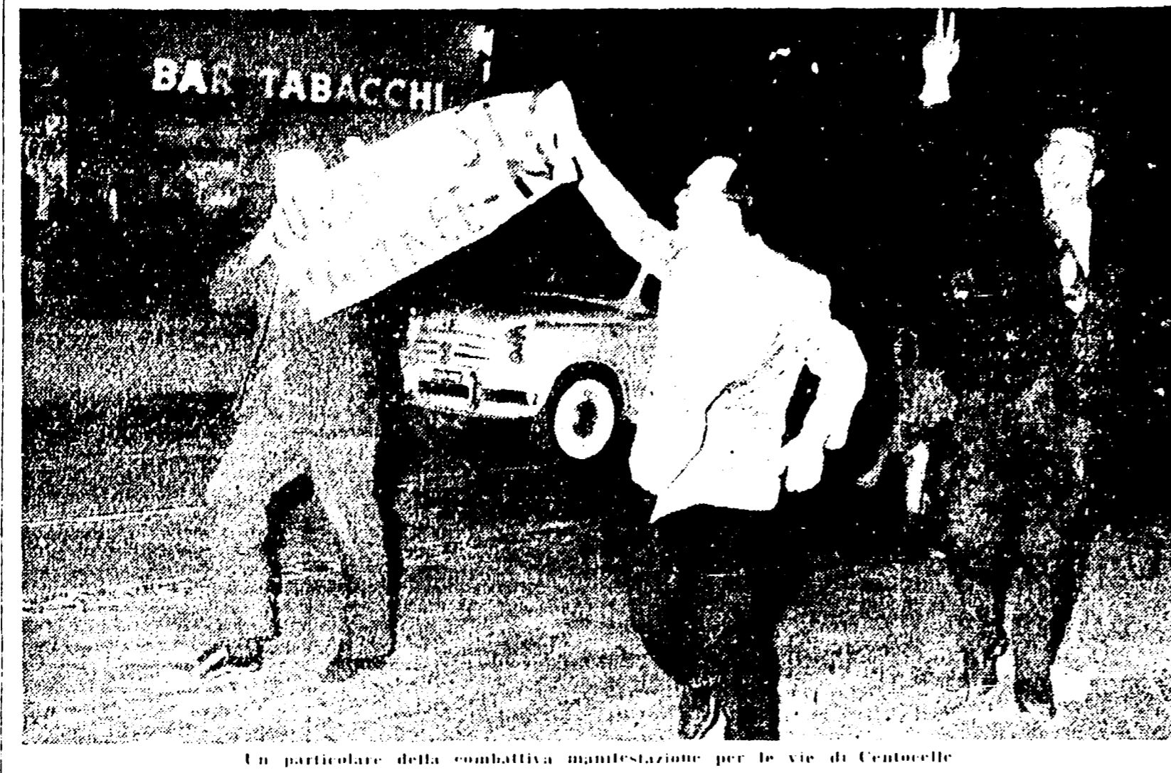
Un particolare della combattiva manifestazione per le vie di Centocelle

Le proiezioni nei cinema sono state sospese a causa della scomparsa di un bimbo. Il piccino è stato ritrovato dopo tre ore. Le autorità stanno cercando testimoni per l'incidente. Si è trattato di un incidente gravissimo, in cui un motociclista è stato decapitato dal parafrangente di un camion. Le autorità stanno cercando testimoni per l'incidente. Si è trattato di un incidente gravissimo, in cui un motociclista è stato decapitato dal parafrangente di un camion.