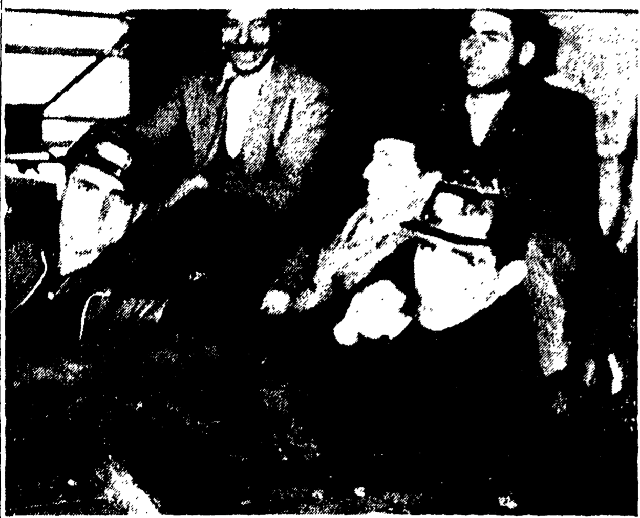
CAGLIARI. Un gruppo di minatori nei pozzi della Monteponi occupati da tredici giorni

Altri lavoratori si appresterebbero a seguire l'esempio - Ancora presidiata la rimessa della S.I.T.A. a Cagliari - Concluso lo sciopero regionale degli autoferrotranvieri