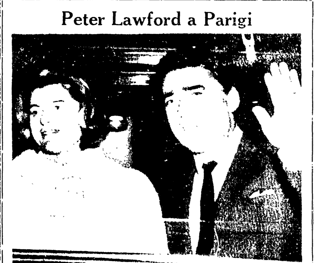
Peter Lawford a Parigi