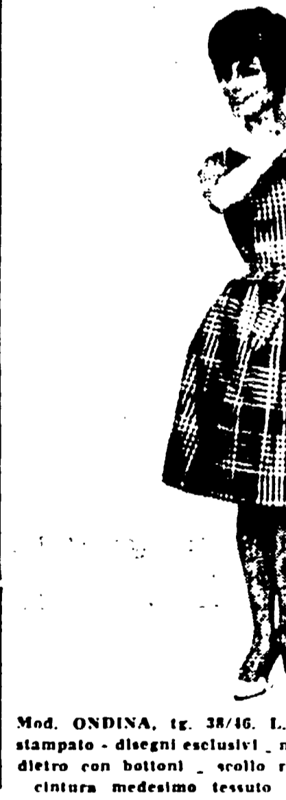
Mod. ONDINA, tg. 38/46, L. 2500 in tessuto inzealabile stampato - disegni esclusivi - mod. senza maniche tutto aperto dietro con bottoni - scollo rotondo - gonna a piezzoline - cintura medesima tessuto - colori e disegni assortiti

nuovo tipo di domanda sul mercato delle confezioni per signora, l'esigenza di un tipo di moda che, pur tenendo conto degli indirizzi e dei rapidi grandi sartorie, si discosta decisamente da ogni preconcetto snobistico e si avvicina democraticamente ai bisogni nuovi di larghissimi strati dei consumatori meno abbienti.