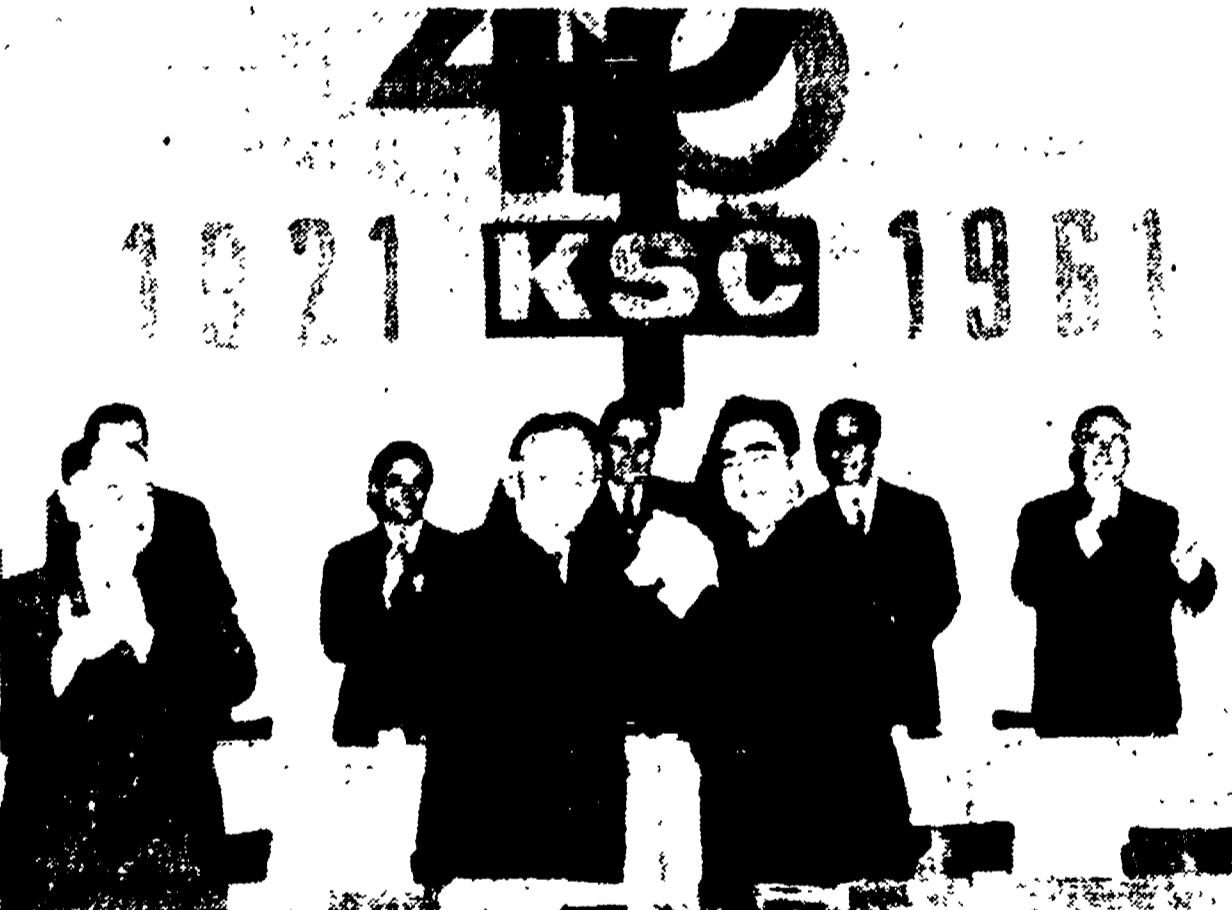
PRAGA. — Un momento della sessione solenne del Comitato centrale del Partito comunista cecoslovacco, tenuta in occasione del 40° anniversario della fondazione del Partito. Novotny, presidente della Repubblica cecoslovaca e segretario del Partito, stringe la mano a Breznev, presidente dell'URSS, in segno di reciproca congratulazione.